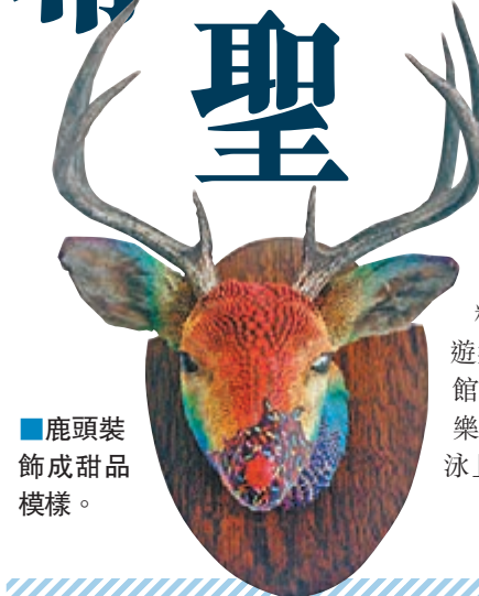
■鹿頭裝飾成甜品模樣。