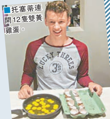
■托塞蒂連開12隻雙黃雞蛋。