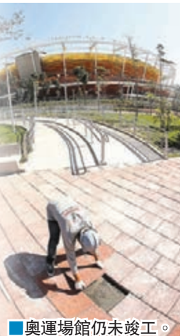
■奧運場館仍未竣工。

巴西里約熱內盧奧運會不足一星期便舉行，但問題接踵而來，繼早前的選手村問題，令部分國家代表團另覓住處後，里約地鐵工會發言人前日表示正與管理層談判加薪，若加薪幅度不滿意，將於下周四午夜，即奧運開幕儀式前一天，發動無限期罷工。此舉勢必癱瘓當地公共交通，影響旅客行程。