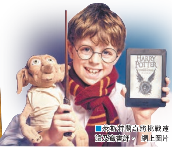
■萊斯特蘭奇將挑戰速讀及寫書評。

暢銷小說《哈利波特》系列風靡全球，如今《哈》迷再有好消息，就是作者羅琳將於明日、即書中主角哈利波特的生日當天，推出該系列第8集《哈利波特與被詛咒的孩子》，勢必掀起新一輪搶購潮。