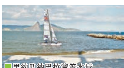
里約瓜納巴拉灣等水域水質污染嚴重。

巴西政府在7年前申請成為主辦國時便承諾要改善鄰近海灣及海灘的水質，但據環保人士與科學家所稱，目前里約水污染程度比預期還要嚴重。根據近期的檢測，里約許多水域簡直是「細菌培養基地」，水中含有可能造成腹瀉與嘔吐的輪狀病毒，以及具有抗藥性、可能造成免疫系統薄弱者致命的超級細菌。巴西當地醫生提出警告，「馬拉松游泳選手簡直是在人類排泄物裡游泳」。選手擔心惡劣的水質情況會使他們的奧運夢碎，一位在瓜納巴拉灣練習的荷蘭籍帆船選手表示：「當水噴上來的時候，我們只能閉緊嘴巴」。