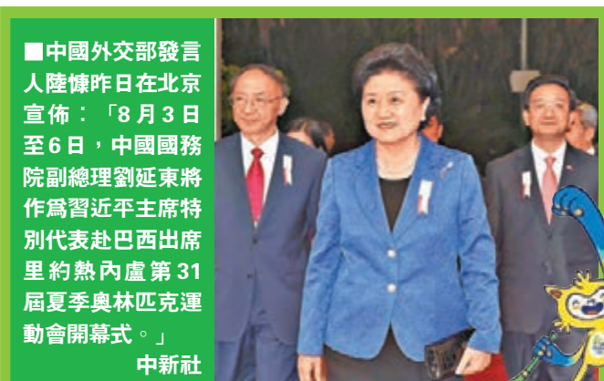
中國外交部發言人陸慷昨日在北京宣佈：「8月3日至6日，中國國務院副總理劉延東將作為習近平主席特別代表赴巴西出席里約熱內盧第31屆夏季奧林匹克運動會開幕式。」