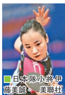
日本隊小將伊藤美誠。

據日本媒體昨日報道，雖然日本乒乓球隊承認與中國隊尚存在差距，但實力之差正在縮小，目前日本隊教練組已經研製一套擊敗國乒的秘笈，並希望成功搶走金牌。