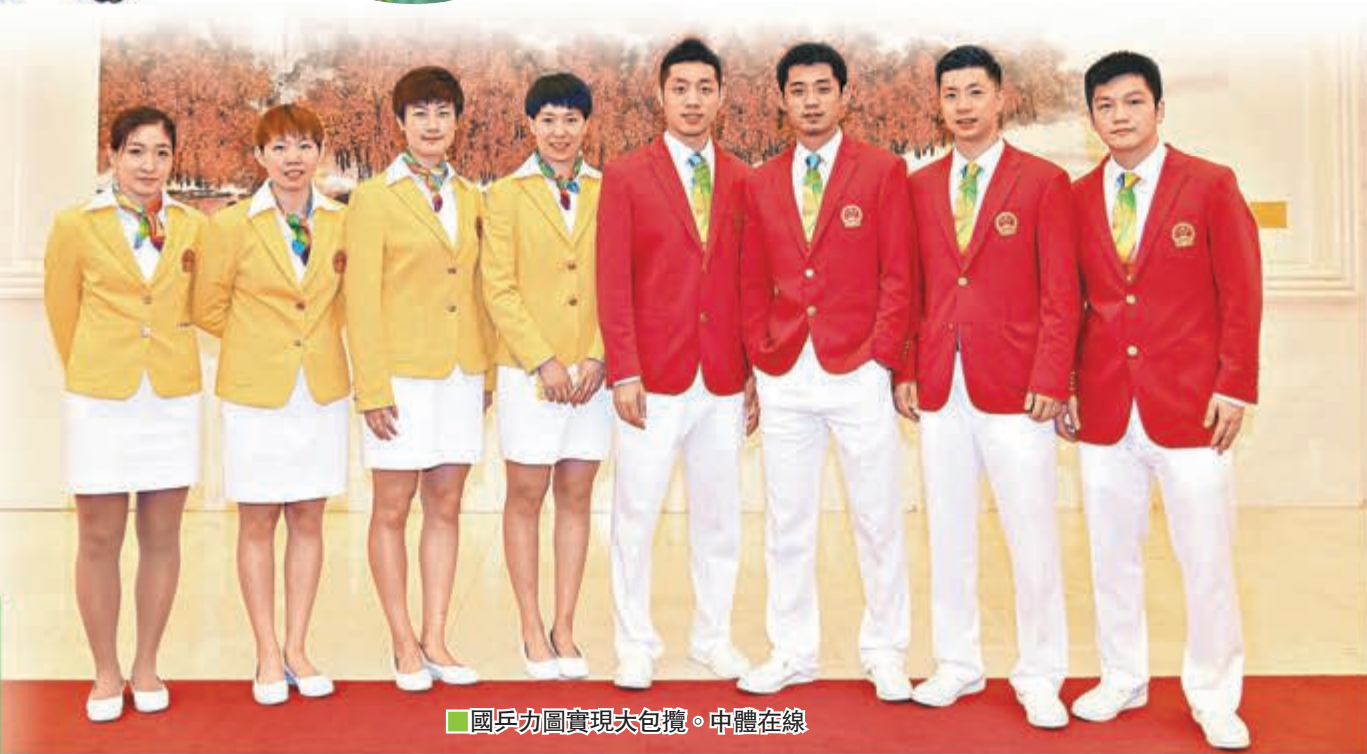
國乒力圖實現大包攬。中體在線