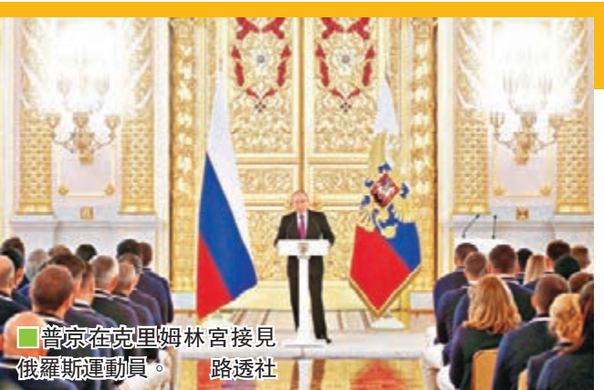
普京在克里姆林宮接見俄羅斯運動員。

當天接受普京總統接見的共有150多名即將赴里約參賽的俄運動員以及未被獲准參賽的部分俄選手。那些征戰里約的俄選手將參加拳擊、排球、手球、乒乓球、蹦床和現代五項等比賽。 ■新華社