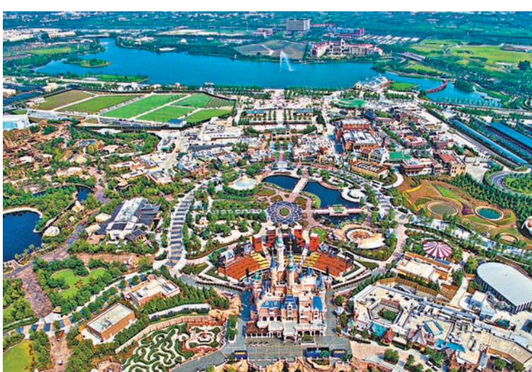
■ 上海浦東祝橋鎮近迪士尼樂園的住宅地，由金地以 88 億元人民幣投得，創今年上海土拍的總價紀錄。圖爲上海迪士尼樂園。資料圖片

昨日到場的 23 家房企包括仁恒、保利、萬科、融創、招商等，競價中不少開發商一上來就是 1 億元、5 億元加價，最終經過長達兩個多小時的拉鋸戰後，金地以 88 億元摘得上海年度總價地王，溢價率 286%，樓板價爲 33,023 元。據中指院統計數據，昨日參與競拍的房企中，報價超過 80 億元的還有融創報 87.95 億元，龍湖報 87 億元，平安不動產報 84.7 億元，足見該地的吸引