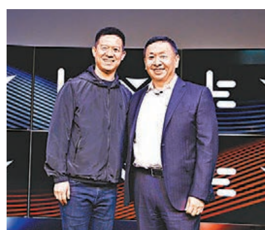
■ 樂視創始人兼 CEO 賈躍亭(左)和 Vizio 創始人兼 CEO 王蔚(右)。