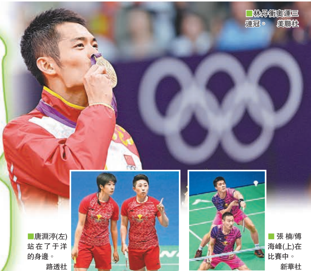
林丹衛奧運三連冠。