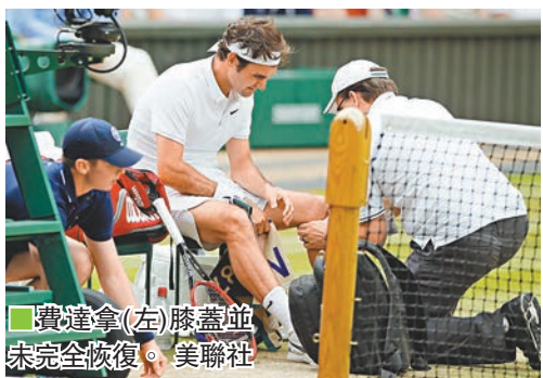
費達拿(左)膝蓋並未完全恢復。

「我非常遺憾地宣佈，我將不會代表瑞士參加里約奧運會並且我將缺席本賽季餘下的所有比賽。」17度大滿貫得主費達拿在社交媒體上說，「經過與醫生和我的團隊反覆商討之後，我作出了這個艱難的決定。在年初接受膝蓋手術之後，我需要讓我的膝蓋得到全面的休養。醫生建議我說，如果我還想健康健康地多打幾個賽季的話，我必須讓我的膝蓋和我的身體都得到徹底的恢復。」 ■新華社