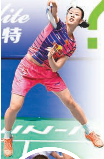
李雪芮力求奧運女單成功衛冕。新華社

雙打項目中，中國隊男雙組合傅海峰/張楠、女雙于洋/唐淵淳、混雙張楠/趙芸蕾躋身種子選手之列，小組賽中強手不多，預計小組出線不成問題。而男雙的柴飆/洪煒、女雙駱贏/駱羽、混雙徐晨/馬晉的小組強手較多，出線難度比較大。 ■新華社