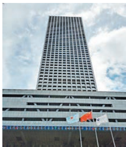
深交所發文強調要從嚴監管熱點題材，稱將果斷遏制市場炒作。圖為深交所新大樓。資料圖片

香港文匯報訊（記者 章蘿蘭 上海報道）深交所發文強調要從嚴監管熱點題材，稱將果斷遏制市場炒作。受此打擊，日前飆升的石墨烯板塊終於領跌兩市，但大市明顯走強，滬指低開高走，最終收漲1.14%，報3,050點，深成指與創業板指也均漲逾1%。近期游資爆炒石墨烯板塊，領頭羊東旭光電被停，都未能遏制炒風，周一