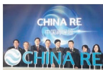
袁臨江(左三)表示，公司希望以新加坡為支點、輻射亞太。

中國再保險董事長袁臨江表示，新加坡是全球重要的國際金融中心，在亞太地區乃至全球範圍內的保險再保險活動中發揮著舉足輕重的作用。當前，中國大力推動「21世紀海上絲綢之路建設」，各方經貿合作進一步加深，大量的保險需求將被激發。新加坡作為「海上絲綢之路」的樞紐，再保險市場發展潛力巨大。公司希望以新加坡為支點，