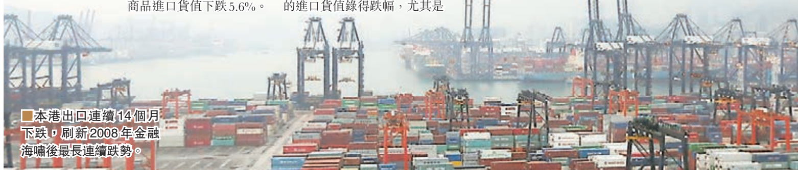
本港出口連續14個月下跌，刷新2008年金融海嘯後最長連續跌勢。