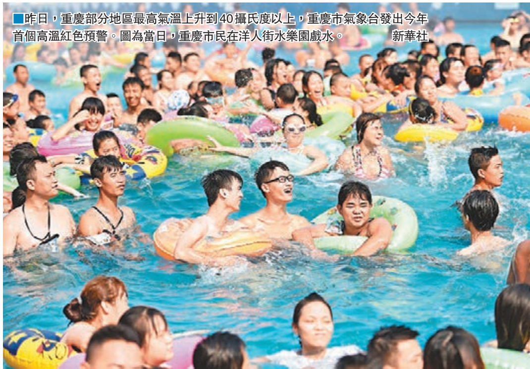
■昨日，重慶部分地區最高氣溫上升到40攝氏度以上，重慶市氣象台發出今年首個高溫紅色預警。圖為當日，重慶市民在洋人街水樂園戲水。

路面燙傷狗爪 火熱的天氣下，各地更是奇聞不斷。江蘇宿遷連日遭遇高溫，不僅人受不了，連水泥路也「受」不了。昨日，宿遷一條水泥路面被曬爆裂拱起，導致一名騎摩托車路過的村民避讓不及撞上拱起的路面，暈倒在地。在江蘇無錫，連續多日出現最高氣溫39℃的天氣，白天馬路溫度更是高達50℃，售賣雞的商販乾脆將即將破殼的小雞苗放在馬路上繼續孵化，很快小雞便破殼而出。網友感慨，「如有神助！」在重慶，有寵物犬的腳爪被滾燙的路面燙傷掉皮。對此，獸醫表示，能讓犬隻燙傷說明地表溫度不低於70℃。 高溫還將持續。中央氣象台首席預報員馬學款表示，華南北部、江南、江漢、江淮、重慶等地高溫天氣或將貫穿至7月底，局部地區氣溫將達39-41℃。預計此輪高溫天氣將致多地高溫天數超常年，部分地區高溫將貫穿整個7月下旬。