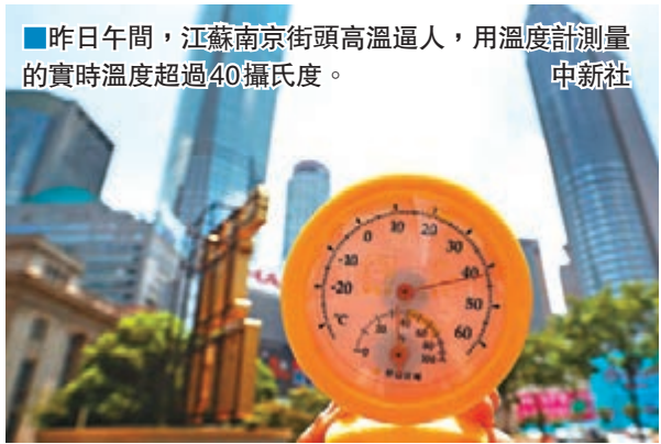
■昨日午間，江蘇南京街頭高溫逼人，用溫度計測量的實時溫度超過40攝氏度。

香港文匯報訊（記者 江鑫嫻 北京報道）內地多地正經歷着今年以來範圍最大、強度最強的高溫天氣過程，特別是南方多個地區的最高氣溫超過了40℃，約有7億人正在遭遇「烘烤」煎熬。氣象專家預計，南方40℃範圍高溫正持續擴大，這股熱力或將持續至本月底。因高溫暴曬，許多民眾中暑就醫。此外，各地還出現了馬路孵小雞、狗爪被燙傷、馬路曬爆裂等系列奇聞。