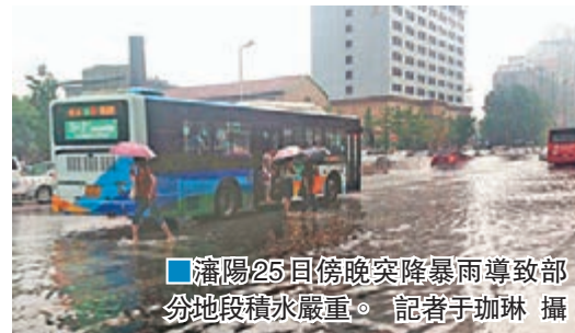
■瀋陽25日傍晚突降暴雨導致部分地段積水嚴重。

強降雨再襲東北 遼寧轉移近14萬人 香港文匯報訊（記者 于珈琳 瀋陽報道）北方汛期以來，新一輪強降水再襲東北，遼寧北部、吉林中部、黑龍江東南部等地局部出現大暴雨。記者從遼寧省防汛抗旱指揮部獲悉，受華北低壓倒槽影響，繼21日出現的大暴雨後，25日、26日遼寧局地又出現特大暴雨。其中，瀋陽市日均降水量達101毫米，是1980年以來最高值，並出現全省最大點降水量，達227毫米，防汛形勢較嚴峻。截至26日8時，遼寧共轉移安置139,134人，無人傷亡。 由於連日集中降水，遼寧防汛形勢較嚴峻。其中大型水庫葫蘆島市青山水庫已超汛限，另有2座大型水庫、8座中型水庫及68座小型水庫超汛限。 瀋陽再啟防汛紅色預警 25日傍晚，瀋陽市降雨量突然增大，並在瀋北新區道義站出現遼寧省最大降水點，瀋陽市城市防汛指揮部繼7月20日後再度啟動城市防汛一級紅色預警。據悉，今年瀋陽防汛主汛期為7月20日至8月20日。 從當日晚高峰開始，瀋陽市多個地區出現大面積積水，內澇嚴重，一度交通擁堵嚴重甚至中斷，車輛拋錨，市民出行困難。同時，正在施工的地鐵工程附近出現面積約25平方米的路面塌陷，導致電力管線斷裂。