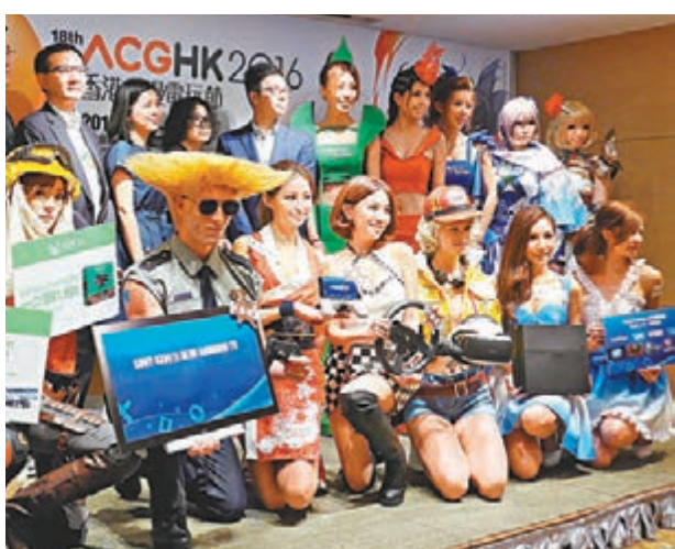
第十八屆動漫電玩節將於周五起一連五日舉行。

其後, 團體更在回收籠中找到約200本棄書, 包括雜誌、小說及英文書等, 其後把棄書搬到貿發局設置的圖書回收站, 待慈善團體將合適的書本轉贈給有需要的人。貿發局傳媒及公共事務部經理鄭釗平表示, 為防止市民在回收籠執書, 已加派保安巡查。他續稱, 貿發局有鼓勵書商, 將棄書捐贈到書展1樓及3樓的捐書點, 捐贈予曙光行動及基督教勵行會。書商將書放進回收籠並不會扣除保證金及影響下年的選擇攤位次序, 只有將書本留在攤位才會被罰。