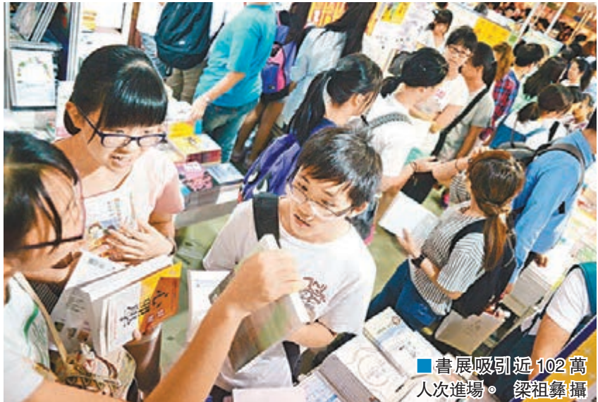
書展吸引近102萬人次進場。