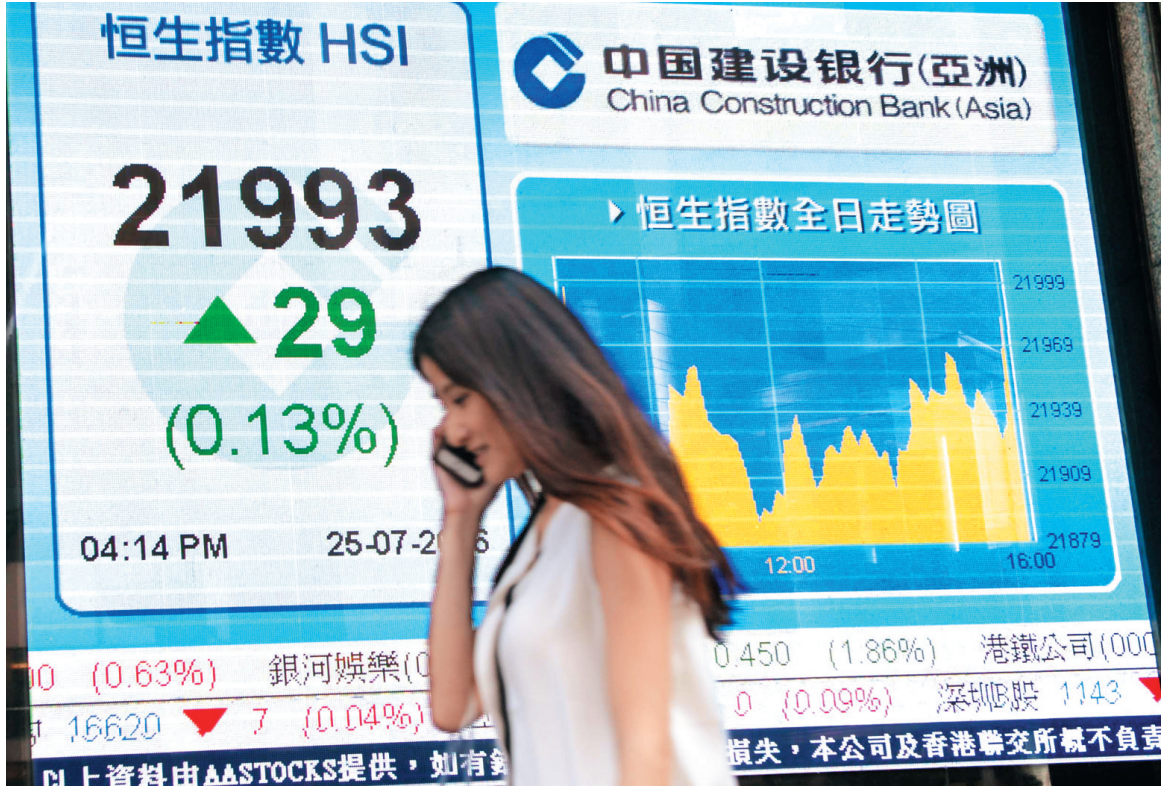
■ 港股昨僅升29點，但主要是U盤時段被夾高，實施首日最後10分鐘為大市帶來額外11億元成交。中新社

大市淡靜下，個別收息股續破頂，中電(0002)以全日高位83元報收，全日升1.3%再創新高。香港電訊(6823)亦升1.1%報12.38元，盤中最高見12.48元。中金公司(3908)的報告指出，截至7月20日的上一周，共有約8.1億美元資金流入中國及香港股市，數字已扣除了中國本地基金的買入，上述數字是去年6月以來，最大的一周淨流入。上周全球新興市場股市共錄得40億美元資金流入，為連續第三周淨流入。