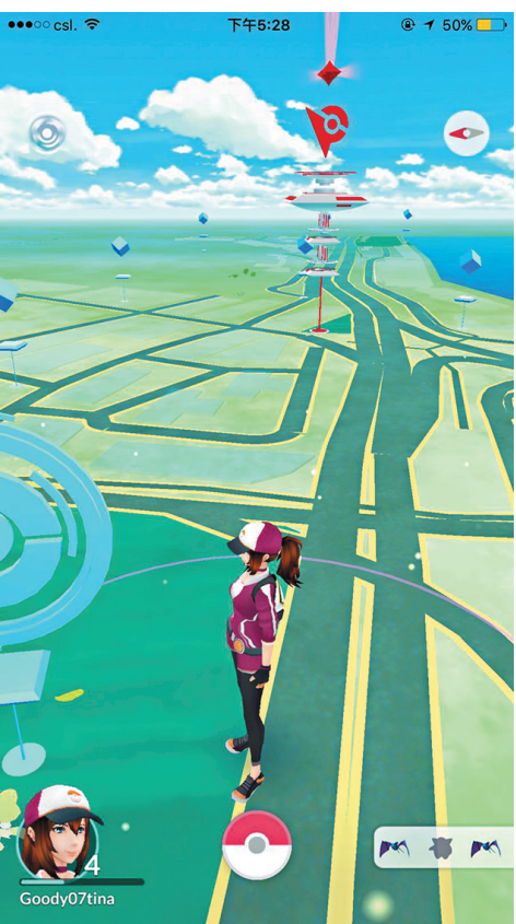
■ Pokemon Go遊戲畫面截圖。

香港文匯報訊(記者 周紹基) Pokemon Go 首次登陸香港，即掀起全城捕捉「小精靈」熱潮，電訊股起舞，已炒作多時的聯想(0992)及瑞聲(2018)則借勢回氣。不過，花旗昨日發表報告，認為Pokemon Go對數據流量需求難有大增長，因為用戶玩Pokemon Go時會減少玩其他遊戲及瀏覽網頁，電訊股其實受惠不多。