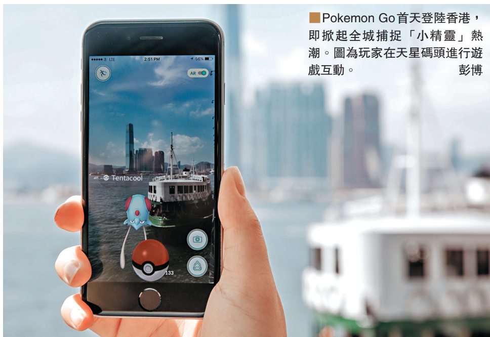
■ Pokemon Go首次登陸香港，即掀起全城捕捉「小精靈」熱潮。圖為玩家在天星碼頭進行遊戲互動。

花旗的報告指，Pokemon Go於未來數月，會逐步在亞太市場推出，或會令用戶的