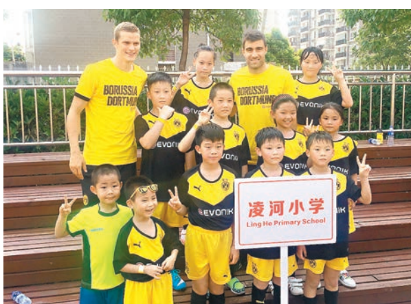
施雲賓達及柏柏斯達夫普路斯與小學生合影。

據Winkler透露，是次項目的後期將主要針對6所小學的足球教練展開，他們將得到德國標準的培訓，學習如何對適齡學生進行足球訓練。值得一提的是，23日，滬氣溫首破40度，但多蒙特球星施雲賓達與柏柏斯達夫普路斯仍於午後出現在球場。他們的出現讓學生們興奮不已，紛紛上前要求簽名和合影。面對孩子們的熱情，兩人始終面帶微笑，一一滿足學生的要求。