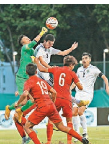
港隊門將(綠衫)化險為夷。

香港文匯報訊(記者 郭正謙)於新加坡參加青年四角賽的港隊U21昨日對烏茲別克，開賽早段打少一人下以0:4不敵，完成賽事的港隊今日返港。