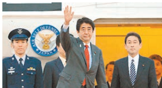
■安倍晉三擬於8月3日改組內閣，有傳外相岸田文雄(右)將離任。