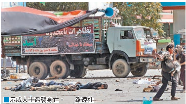
示威人士遇襲身亡。

阿富汗首都喀布爾昨日發生自殺式炸彈襲擊，當地大批少數族裔哈扎拉人上街示威，抗議政府興建的一條主要電纜，繞過哈扎拉人聚居的巴米揚省，兩名兇徒突然在人群中引爆炸彈，造成最少80人死亡、231人受傷，預料死亡人數陸續上升。極端組織「伊斯蘭國」(ISIS)透過Amaq通訊社發表聲明，承認襲擊是其所為。