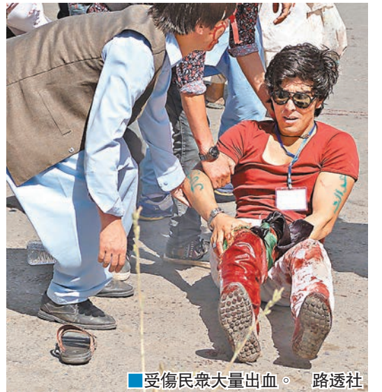
受傷傷民大量出血。