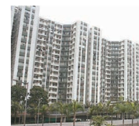
黃埔花園2房單位月內成交價相差逾30萬元。

中原趙鴻運透露，鯉魚涌太古城海閣高層D室，實用面積922方呎，6月時放盤叫價1,450萬元，最終累積減60萬元以1,390萬元將單位易手，折合呎價15,076元。原業主於1988年以139萬元買入單位，持貨28年升值9倍，賬面袋走1,251萬元。