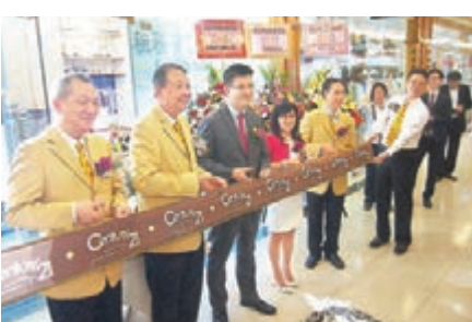
九建與世紀21合作，在柴灣杏花邨設租務諮詢中心。

另外，宏安地產行政總裁黃耀輝昨日出席美聯新分行開張儀式時稱，旗下馬鞍山書閣樓書製作已屆尾聲，最快下月公佈樓書並隨即推售。