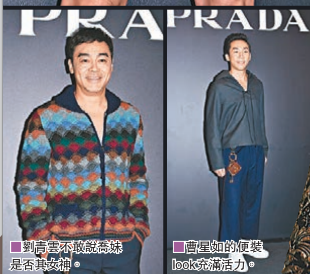
劉青雲不敢說喬妹是否其女神。