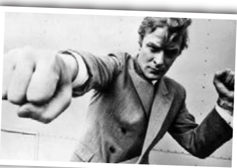
年輕時的高堅十分俊俏。

英國老牌男星米高堅(Michael Caine)原名莫里斯·米克爾懷特(Maurice Micklewhite)，幾十年來他的護照依然使用本名。近年由於極端組織「伊斯蘭國」(ISIS)猖獗，令他每次在機場出示護照時，均被保安問一連串問題，米高堅不堪其擾，終決定將藝名作為本名使用。