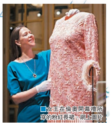
女王在倫敦開幕禮所穿的粉紅長裙。網上圖片

英女王伊利沙伯二世登基至今已64年，多年來她不論參加王室公務，抑或出席大小場合，都非常注重衣裝。白金漢宮近日舉辦「時裝王朝」展覽，展出英女王多年來穿過的80多套服飾，從中可一窺她的衣品及獨到眼光。展覽展出英女王年輕時和近年的服飾，可看出其衣品風格如何隨年代轉變。展覽亦集中探討英女王如何按照不同的外交場合，搭配顏色、花紋及飾物，例如2012年倫敦奧運開幕禮所穿的粉紅長裙，稱她刻意選取中性顏色的衣服，避開參與國家的代表色，以示中立。 ■《每日電訊報》/《每日郵報》