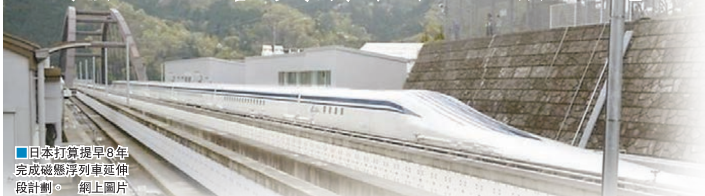
日本打算提早8年完成磁懸浮列車延伸段計劃。網上圖片

日本傳媒報道，首相安倍晉三政府計劃推出總值超過20萬億日圓(約1.5萬億港元)的刺激經濟措施，當中3萬億日圓(約2,199億港元)以「財政投資及貸款計劃」(FLIP)方式，貸款予日本東海旅客鐵道公司(JR東海)，期望較原定時間提早8年完成磁懸浮中央新幹線延伸段計劃。然而，這做法招致多方批評，指計劃的經濟效益及技術出口潛力有限，是將政治考量置於經濟利益之上。