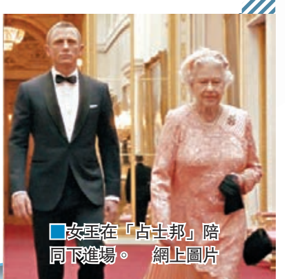
女王在「占士邦」陪同下進場。