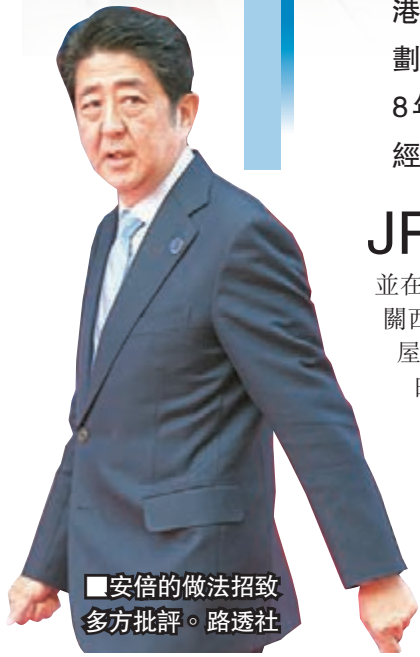
安倍的作法招致多方批評。路透社

JR東海部分高層人員擔心，政府借款後必會嘗試干預業務，希望公司總裁拒絕接受。 ■路透社/共同社