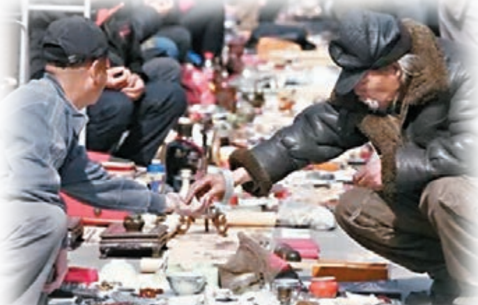
■據業內人士稱，銀川市西塔古玩市場所銷售的賀蘭硯真品、精品比例不足30%。圖為市民在該市場內尋寶。 網上圖片

示，目前寧夏擁有賀蘭硯雕刻的國家級和自治區級工藝美術大師近三十人，從事賀蘭硯雕刻的工藝師一千多人。由於「無米下鍋」，很多工藝師長期得不到賀蘭石原料，只好轉行或到外地尋求發展。