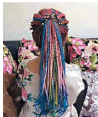
■非洲小辮髮型受北上廣青年追捧。

隨着中國和非洲交流的日益密切，展現着非洲人熱情奔放特質的小辮髮型在內地也越來越常見。