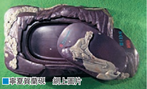
■寧夏賀蘭硯 網上圖片

賀蘭硯，寧夏「五寶」之一，被譽為「一端二款三賀蘭」，其原料賀蘭石更是以質地細密、入手潤滑而出名。但近年來，賀蘭硯行業假貨充斥、市場混亂，業界人士紛紛反映，「無米之炊」凸顯困境。最近，寧夏賀蘭硯雕刻師見面，打招呼語已變成「你還有石頭嗎？」