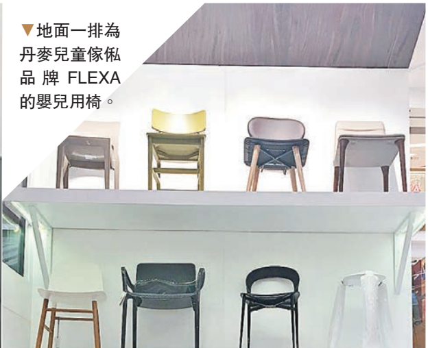
▼地面一排為丹麥兒童傢俬品牌FLEXA的嬰兒用椅。