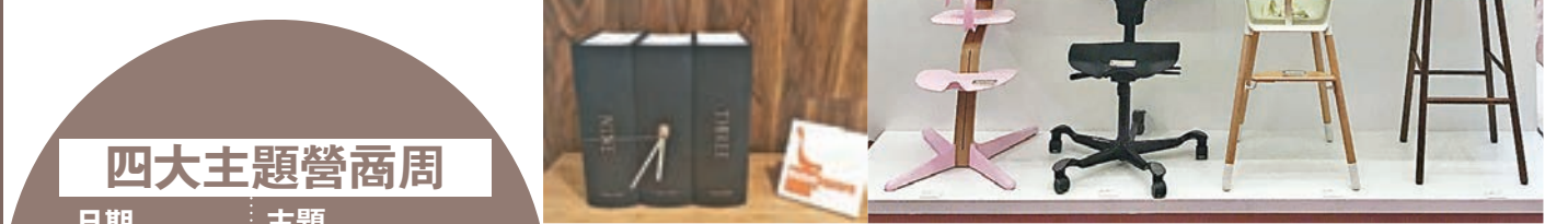
▼Present Time 座枱鐘。