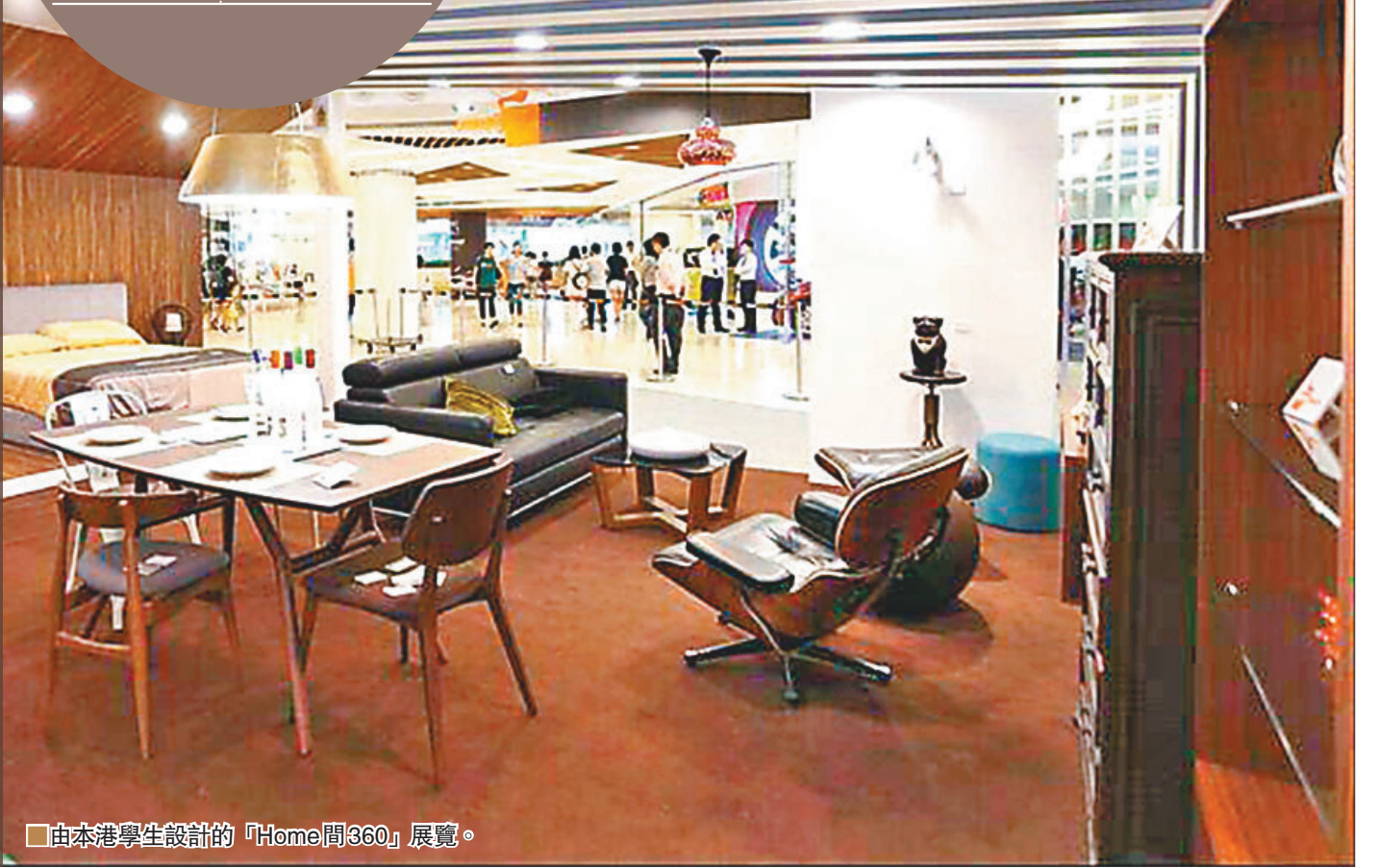
■由本港學生設計的「Home間360」展覽。