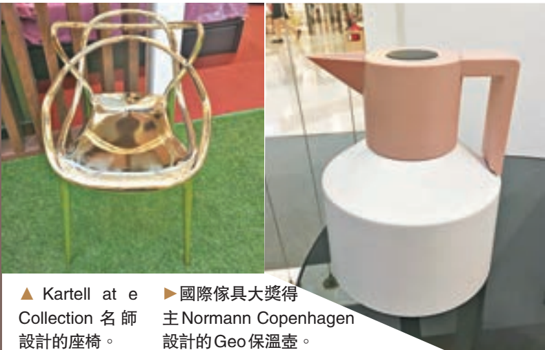
▲Kartell at e Collection 名師設計的座椅。 ▶國際傢具大獎得主Normann Copenhagen設計的Geo保溫壺。