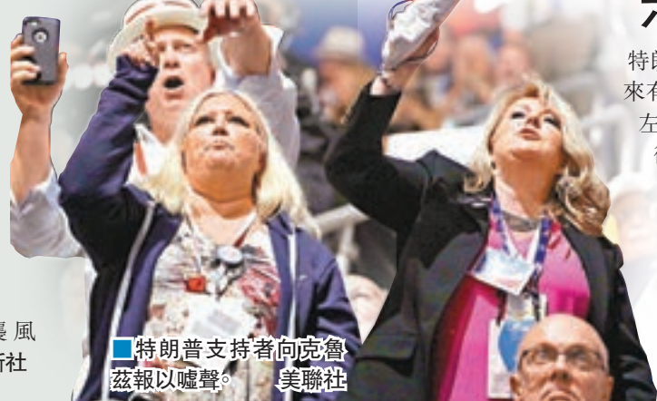
特朗普支持者向克魯茲報以噓聲。

克魯茲與特朗普在初選期間互相人身攻擊，克魯茲前晚僅在演說開首「恭喜特朗普贏得提名」，就再沒提到對方的名字。