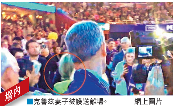
場內 克魯茲妻子被護送離場。