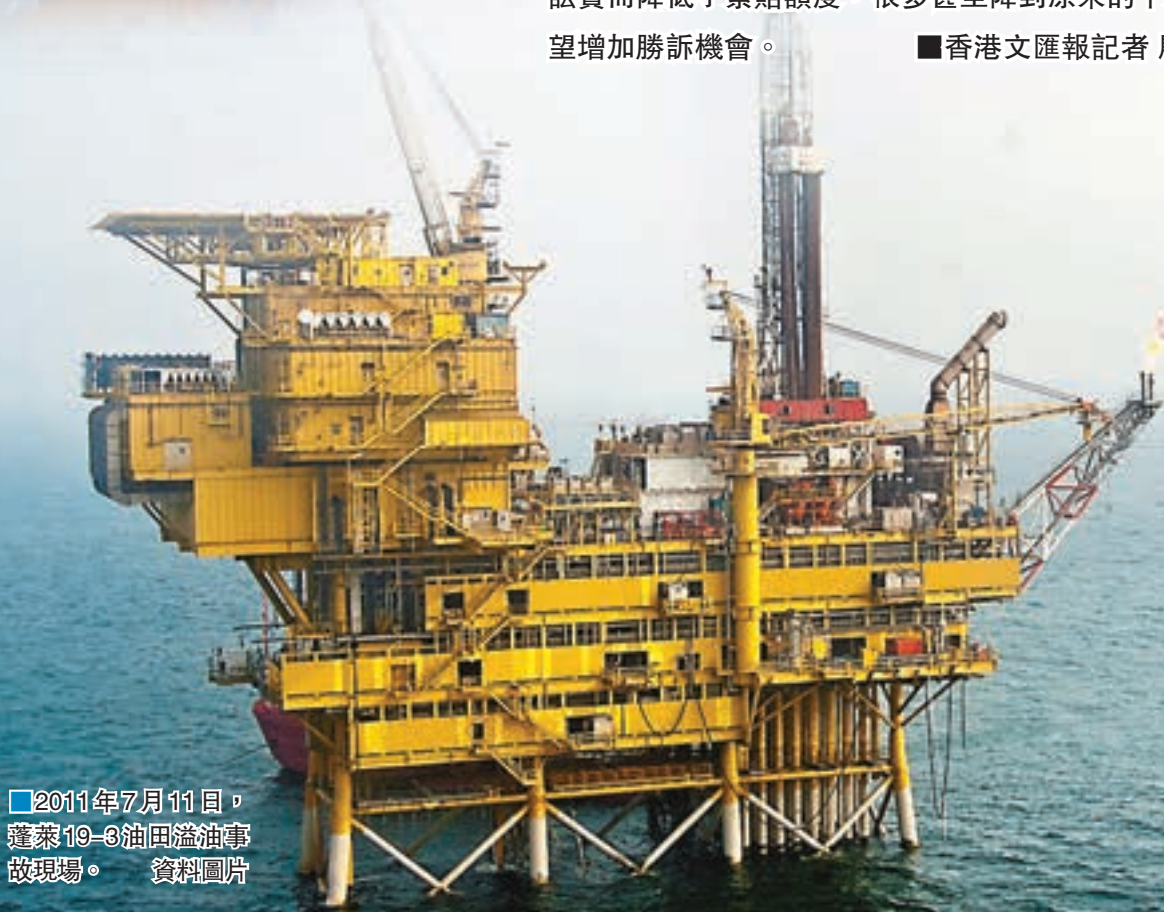
2011年7月11日，蓬萊19-3油田溢油事故現場。資料圖片

時隔五年，2011年渤海灣蓬萊19-3油田溢油事故近日再次引起關注。上月下旬，山東近200戶漁民養殖戶籌集逾200萬元（人民幣，下同）訴訟費至青島海事法院，起訴美國康菲石油中國有限公司、中國海洋石油總公司。距事故區域最近的島嶼煙台砣磯島漁民哭訴，自2011年6月溢油事故發生後，當地養殖的扇貝因遭污染一度幾乎全軍覆沒，遂於2012年遞交起訴狀，但直至2015年10月底才獲法院受理。由於案件受理拖了數年，且遲遲沒有結果，因此在此番起訴中，部分漁民承擔不起高額的訴訟費而降低了索賠額度，很多甚至降到原來的十分之一左右，希望增加勝訴機會。 ■香港文匯報記者 殷江宏 山東報道