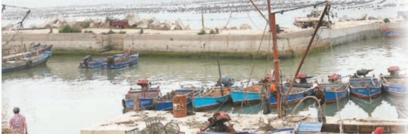
海上養殖是山東砣磯島漁民的主業。

2012年6月：聯合調查組宣佈，事故造成油田周邊及其西北部面積約6,200平方公里的海域海水污染；康菲作為作業者承擔全部責任。