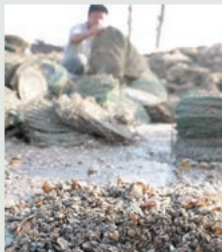
受渤海溢油事故影響，河北省樂亭縣的扇貝養殖戶當年損失慘重。