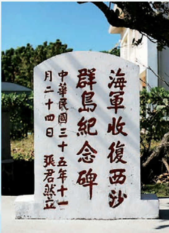
■永興島上的收復西沙紀念碑。

由於三沙面積有限，三沙允許企業註冊在三沙，但在其他地方展開經營。據新華社報道，截至去年底，三沙市註冊企業達119家，個體工商戶110家，全市註冊企業和個體工商戶註冊資本17.08億元，實現稅收超過7億元。