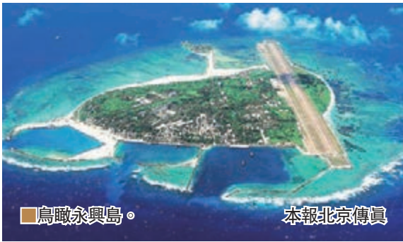
■鳥瞰永興島。