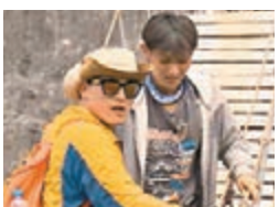
孫藝洲助黃子韜克服恐懼

香港文匯報訊(記者趙邑)內地節目《我們的法則》正熒屏熱播，其第七期即將於本週六再次與觀眾見面。據介紹，在本期節目中，「叢林家族」成員吳奇隆、李亞鵬、小沈陽、黃子韜、孫藝洲、邢傲偉、熊黛林將挑戰攀登世界上最大的石林——馬達加斯加的大響吉(Grand Tsingy)。