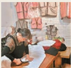
■ 在編織區，你可以體驗一下編織的滋味。