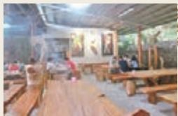
■ 達基力創作室內還設有餐廳