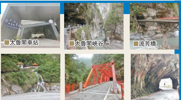
■ 太魯閣車站 ■ 太魯閣峽谷 ■ 流芳橋 ■ 長春祠 ■ 長春橋 ■ 太魯閣燕子洞口

優美壯麗的奇景，令人驚嘆的奇岩峭壁。另外，太魯閣的中橫公路長春隧道西口，坐落著一座精巧莊嚴的長春祠，外形為唐代廟堂式的建築，古典而雅致，祠內供奉著為興建中橫公路而殉職的 225 位築路英雄，而祠旁的湧泉由山壁間傾瀉而下，形成白絹飛瀑，為中橫公路著名的「長春瀑布」。