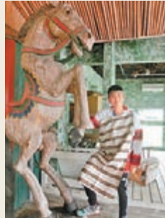
■ 團友試穿織娘織出來的布做成的衣服。