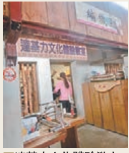
■ 達基力文化體驗教室