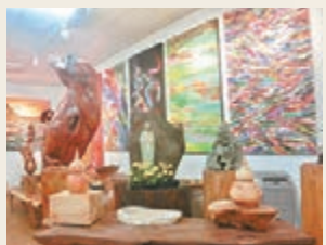
■ 在達基力創意工作室內，你可欣賞郭文貴油作。