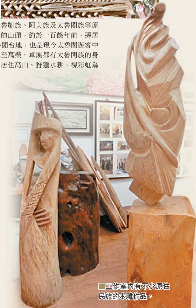
■ 工作室內有不少原住民民族的木雕作品。

秀林鄉北端的崇德村有個達基力部落屋又叫達基力創作工作室，不但有藝術木雕、石雕、油畫可欣賞，也有文創體驗以及太魯閣族經營的風味餐廳。創作工作室傳遞著太魯閣族的人文藝術及飲食文化，具備了藝術創室環境，讓同好來品茶畫畫、DIY 織布、縫製衣服的體驗室，如博物館的餐廳。餐廳以當天採購來自部落周邊的野生山雞、山豬、自己耕種或收購的太魯閣族傳統食材山胡椒、食茱萸、小米、樹豆、山蘇、山萵蒿、龍葵、箭筍、剝皮辣椒、藤心、菜豆、洛神花、桂竹筍等天然作物用心料理，將太魯閣族傳統菜餚經過創意巧思製成符合現代旅客的口味的菜餚。餐廳四周用花蓮藝術家的油畫作品、木雕、石雕做裝飾，既原始又充滿藝術味，加上野味的食品乃雙重享受。