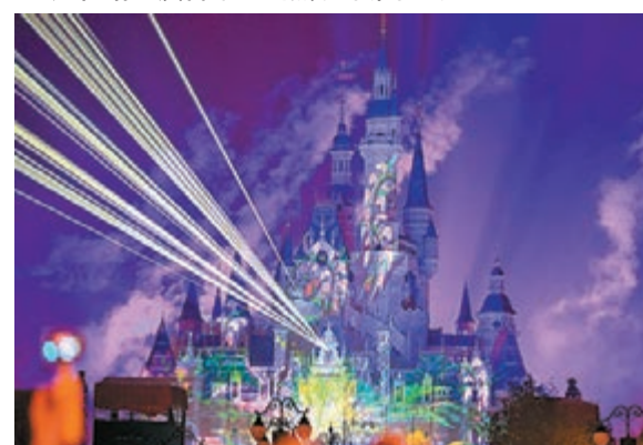
美輪美奐燈光煙花秀 燈光煙花秀讓上海迪士尼城堡變得幻彩無比，華美絢麗。