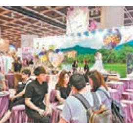
■ 台灣觀光局為台灣婚紗業界參加婚展打氣