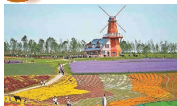
東北最大薰衣草莊園開門迎客 遊人在哈爾濱普羅旺斯薰衣草莊園內遊玩。