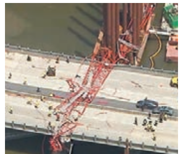
美國紐約前日發生起重機倒塌意外，橫跨哈德遜河的舊塔潘奇伊大橋其中一段路面被壓毀，兩架途經現場的汽車閃避時相撞，兩名司機受傷，另有一名建築工人受輕傷。

美國紐約前日發生起重機倒塌意外，橫跨哈德遜河的舊塔潘奇伊大橋其中一段路面被壓毀，兩架途經現場的汽車閃避時相撞，兩名司機受傷，另有一名建築工人受輕傷。失事起重機約78米高，當時正在