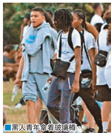
黑人青年拿着玻璃樽。

目擊者稱，當時公園周圍都是10多歲的男女，部分男子更「手持開山刀跑來跑去」，現場照片顯示在場不少都是黑人青年。警員後來築起防線，人群於昨日凌晨1時半左右才散去，未有人被捕。 ■《每日郵報》