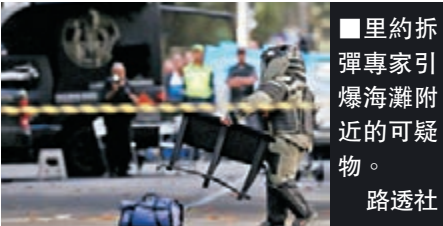
■里約拆彈專家引爆海灘附近的可疑物。路透社

巴西里約熱內盧奧運還有半個月便開幕，專門監察網上恐怖主義情報的美國反恐情報集團SITE表示，一個名為「Ansar al-Khilafah Brazil」的組織，周日透過手機通訊程式Telegram，宣誓效忠極端組織「伊斯蘭國」(ISIS)首腦巴格達迪，並透過阿拉伯語、英語及葡語宣揚ISIS「理念」。巴西當局前日表示，正調查所有安全威脅，確保奧運安全舉行。歐美多國近期頻頻遭受恐襲，巴西亦提升保安級別，包括在奧運設施及交通要道舉行演習，設置警戒線，並部署超過8.5萬名軍警維持秩序。