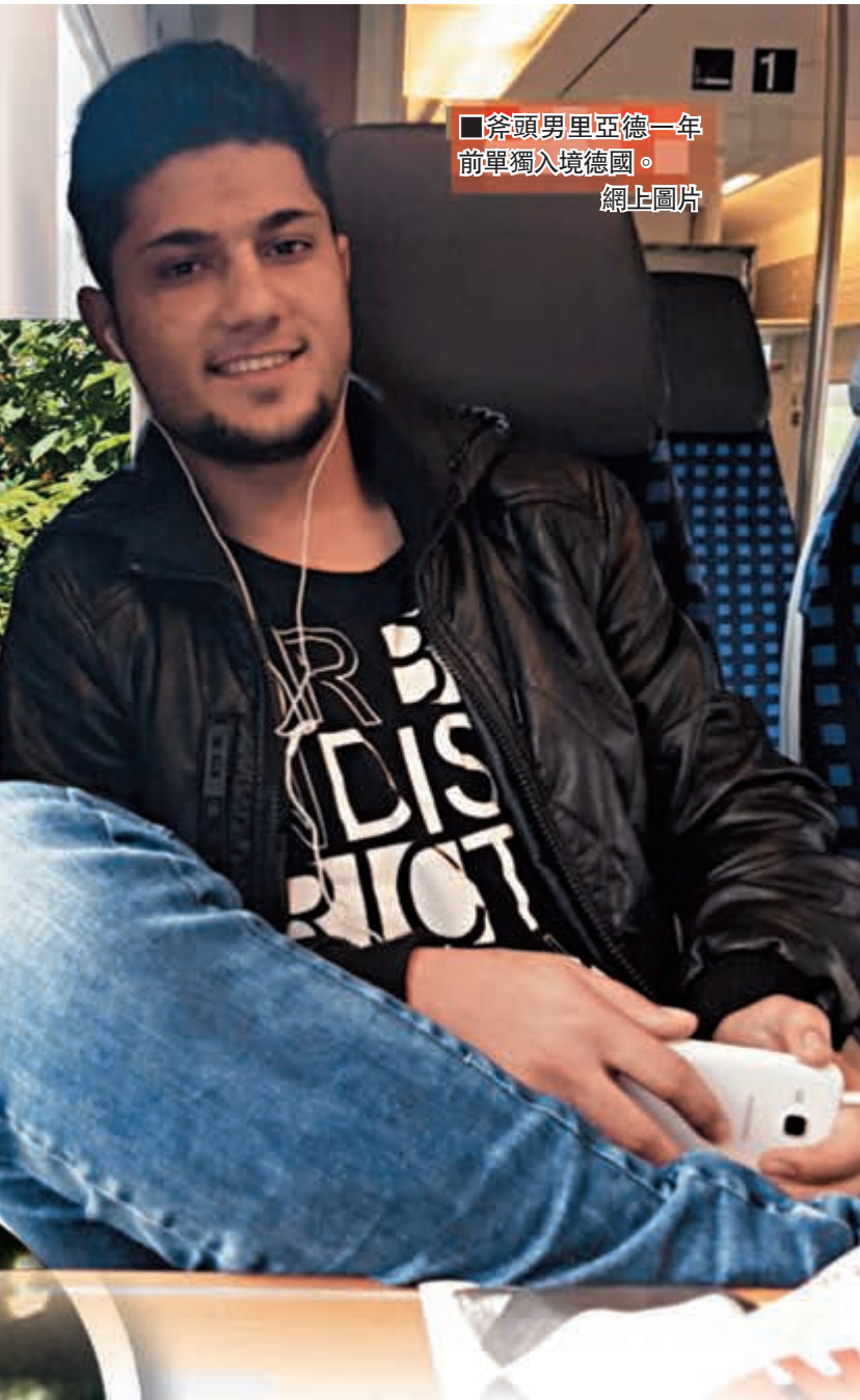
■斧頭男里亞德一年前單獨入境德國。

列車其後緊急停車，兇徒逃跑期間，砍傷一名遛狗的德國女子，又向對方說德語粗口，揚言要「幹掉」她。當被圍捕時，他曾持斧頭砍向警員，最後被警員開槍擊斃。兇徒襲擊手法血腥，約20名目擊者因受驚嚇感不適。赫爾曼表示，記錄顯示兇徒在阿富汗出生，一年前單獨入境，兩周前獲收養。當地傳媒報道，警方在兇徒住所找到巴基斯坦身份證明文件，加上他在ISIS發佈的短片中，所說的普什圖語有巴基斯坦口音，懷疑他是來自