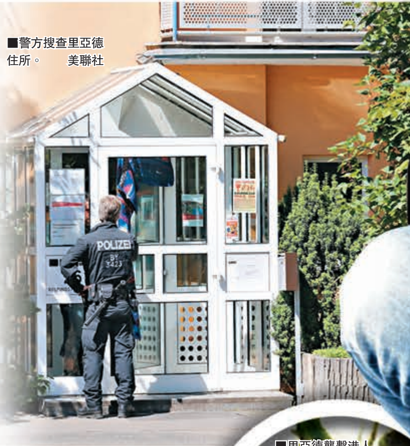
■警方搜查里亞德住所。

德國一名17歲男子周一晚在南部一列火車上以斧頭及利刀施襲，造成4名港人乘客及一名當地人受傷，極端組織「伊斯蘭國」(ISIS)承認責任，是該組織首次宣稱在德國施襲。事件亦有更多細節曝光，巴伐利亞州內政部長赫爾曼透露，兇徒行車期間佯裝如廁，其後隨即行兇。