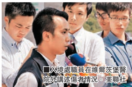
■以境處職員在維爾茨堡醫院外講述傷者情況。