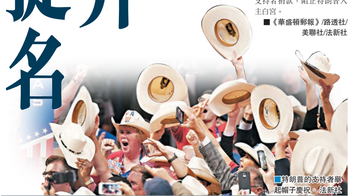
■特朗普的支持者舉起帽子慶祝。