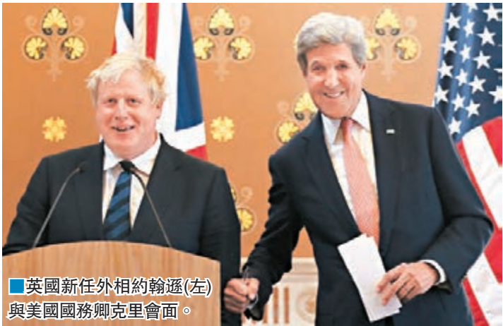
■英國新任外相約翰遜(左)與美國國務卿克里會面。