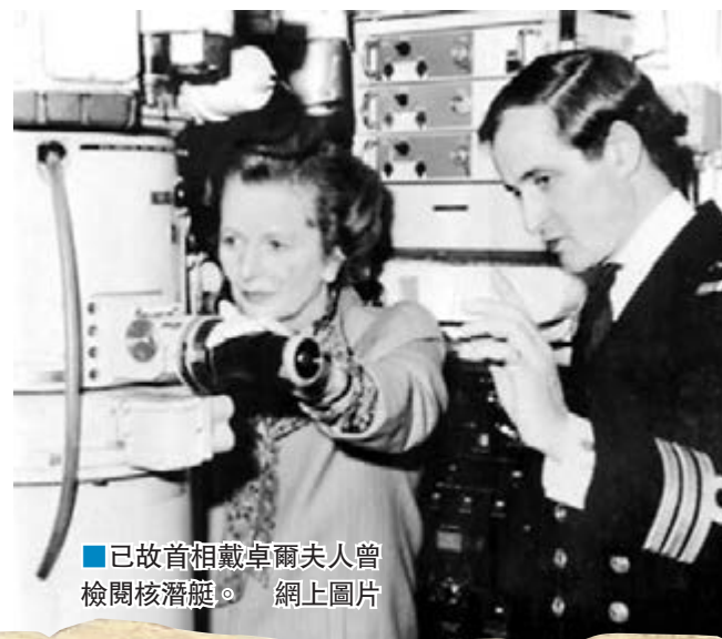
已故首相戴卓爾夫人曾檢閱核潛艇。網上圖片