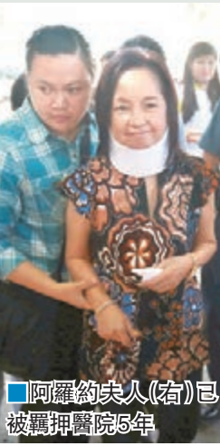
阿羅約夫人(右)已被羈押醫院5年

阿羅約夫人在上任總統阿基諾三世統治期間遭羈押，但她在菲政壇仍具影響力，甚至在5月獲選連任國會議員。杜特爾特獲選出任總統後，曾表示會尋求釋放阿羅約夫人，並稱願意給予特赦，但遭對方拒絕，表示會抗辯到底。