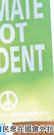
民眾在國會外抗議核武。

在野工黨傳統上是支持升級核潛艇，而一直致力反對升級計劃的工黨黨魁郝爾彬，前日在國會堅持固有立場投下反對票。不過工黨分裂有加劇跡象，多達140名工黨成員投支持票，反對的只有47人，甚至比全部54名黨員投下反對票的蘇格蘭民族黨還要少。報道形容這是郝爾彬上任黨魁以來，黨內最大規模的「叛變」。