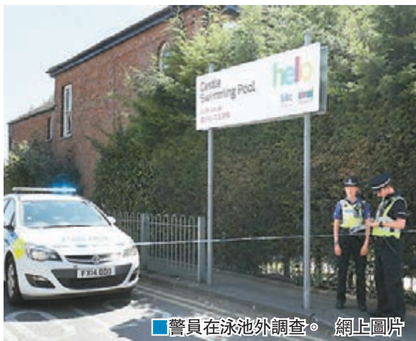
警員在泳池外調查。

英格蘭東部昨日發生槍殺案，一名槍手在林肯郡斯波爾丁市一個泳池附近，槍殺兩名婦女後吞槍自殺。警方相信槍手單獨犯案，不涉恐怖主義。社交媒體消息指事件或由家庭糾紛引起。