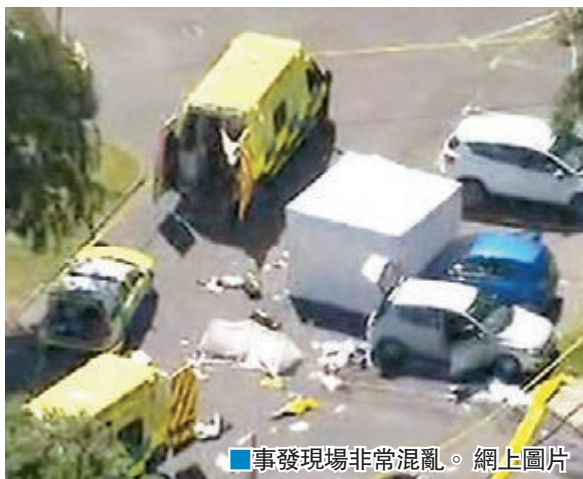
事發現場非常混亂。