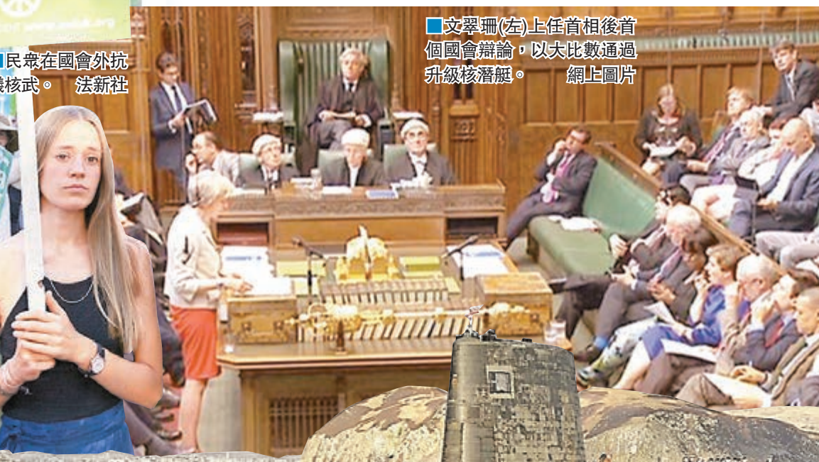
文翠珊(左)上任首相後首個國會辯論，以大比數通過升級核潛艇。

相反，今次議案順利通過，將有助文翠珊修補因脫歐公投而分裂的保守黨。 ■《每日電訊報》