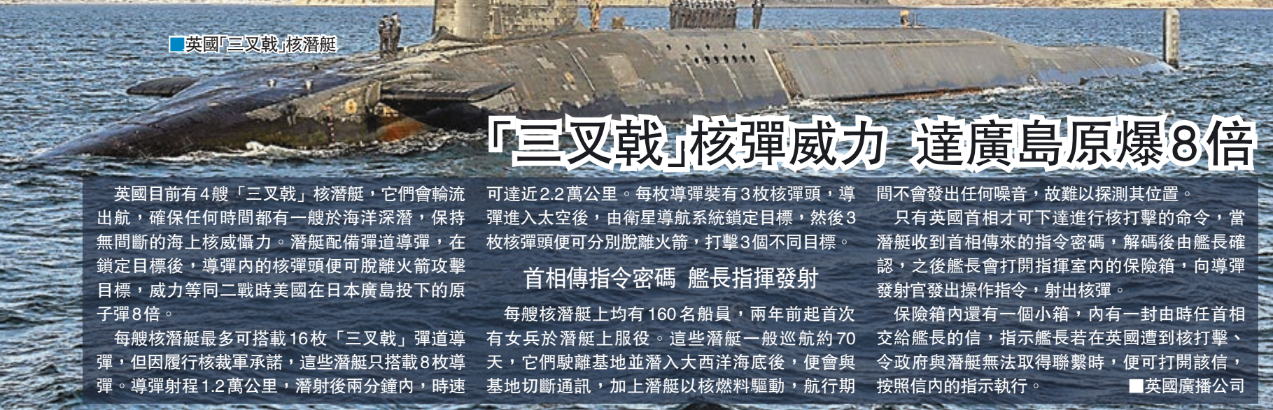
英國「三叉戟」核潛艇