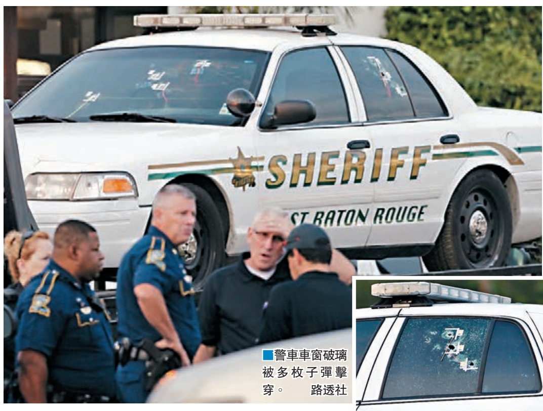
警車車窗玻璃被多枚子彈擊穿。