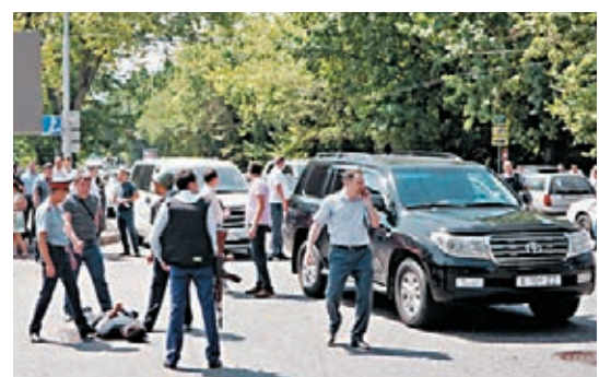
■被捕疑犯雙手反綁，背朝天躺在地上。

當地傳媒拍到警車內有警員受傷，車內外有血跡，另有網民發佈相信是裝甲車在阿拉木圖行駛的