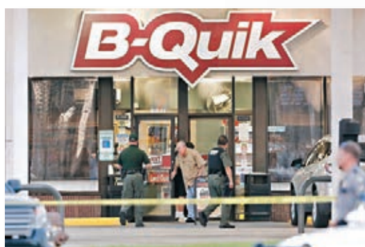
執法人員在油站便利店搜證。