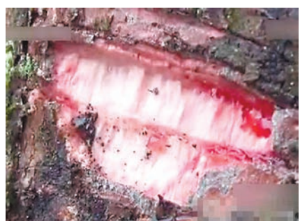
■大樹流出紅色漿液。

重慶一組大樹「流血」的圖片近日走紅網絡。這顆直徑約30厘米的樹木，外觀和普通的樹沒什麼區別。當地居民稱，近日一司機開車不小心撞傷了這棵樹。