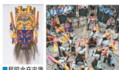
■程咬金在屯堡地戲中的造型。 ■貴州安順九溪女子地戲。

中國(安順)屯堡面具節近日在貴州拉開序幕，在「假面舞會」中，將以「真情假面，嗚呼明朝」為主題，舉行各國面具大舞會，現場向觀眾和遊客發放面具，讓遊客和觀眾充分參與，一起狂歡。該活動至8月5日至7日將達到高潮，並持續至8月中旬。