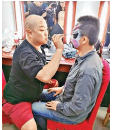
■交流團到梅蘭芳大劇院觀看京劇,團員親身體驗京劇的勾臉譜。

團員們在北京5天行程,還將參觀前門大街、八達嶺長城、頤和園、故宮,觀看雜技等民族文藝節目。團員們還將在國家會議中心參加「京港青年慶祝香港回歸祖國20周年首發式暨聯歡活動」,與內地青年聯歡,共同尋根追夢,希望這是一次「四海一家」團結歡樂的青春盛會。「四海一家·香港青年創新創業交流團」已是第二年舉行,去年主辦單位組織了2,500多名香港青年分別赴北京、上海、廣東等地交流,幫助本港青年全面深入地了解國家發展形勢,增進民族認同感和歸屬感,更好地把握時代機遇,共創美好未來。今年,他們再次組織2,000名香港青年分別在北京、福建、深圳等地展開豐富多彩的歷史文化之旅,感受中國特色歷史文化。今年交流活動主題定為歷史文化體驗之旅,交流團香港成員包括新來港、基層青年、優秀青年精英代表和資深青年工作者等。