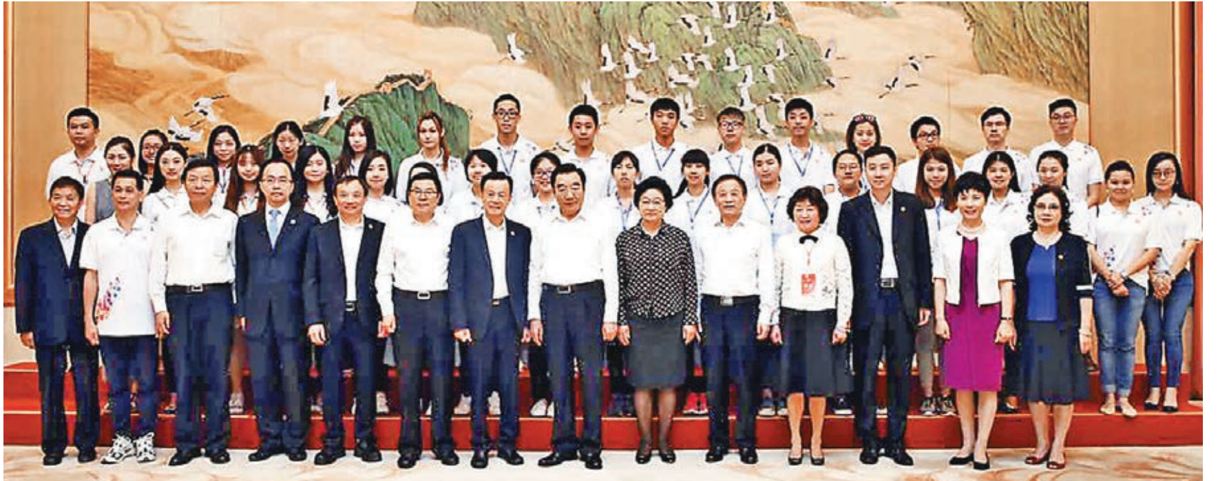
■全國政協副主席兼秘書長張慶黎與團員代表合影。