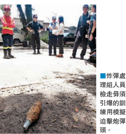
炸彈處理組人員檢走毋須引爆的訓練用模擬迫擊炮彈頭。

昨晨9時許工人開工期間，發現3枚疑似炸彈的金屬物體，大驚報警。警員到場發覺該3件物體同長約30厘米及直徑約10厘米，不排除是英軍撤走後遺下的炸彈，於是疏散地盤數十名工人，消防員則開喉戒備。警方爆炸品處理人員到場檢驗後，相信發現的物品包括兩個火箭推進器、一個火箭連接器及一枚相信是訓練用的迫擊炮彈頭。至中午引爆迫擊炮其中三部分，包括藏有炸藥的推進器及兩個連接器，至於迫擊炮的彈頭內裡並沒炸藥，經檢驗證實沒有即時危險，由警員檢走。警方表示該支迫擊炮是英國製造，相信只供訓練用。