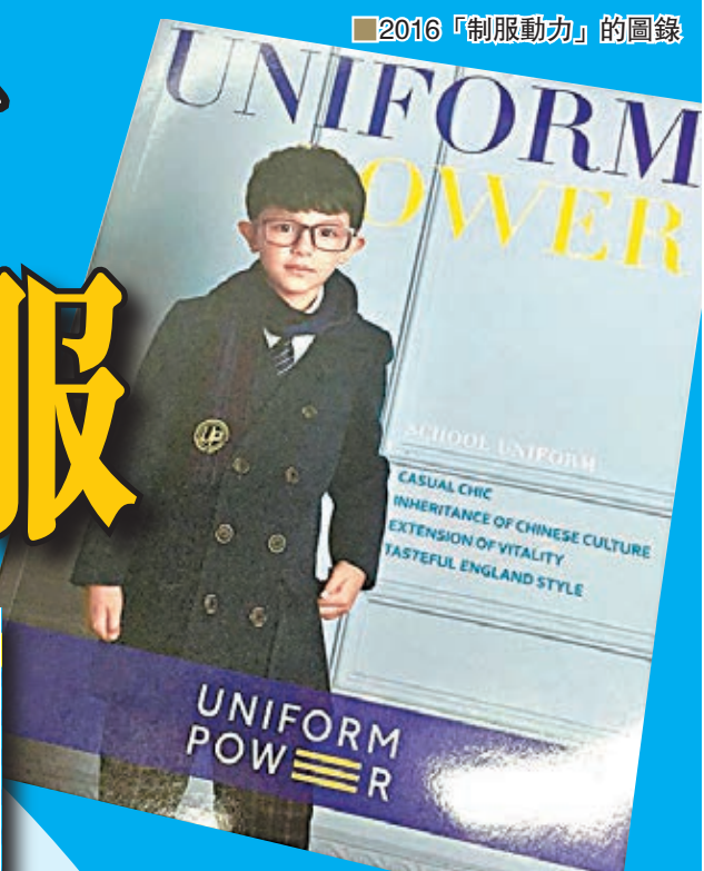
制服動力為澳門利瑪竇中學設計的校服樣板