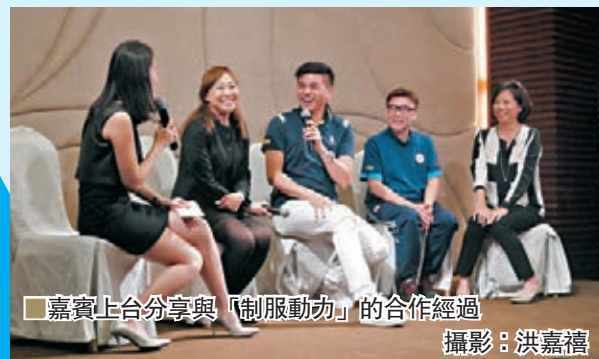
嘉賓上台分享與「制服動力」的合作經過