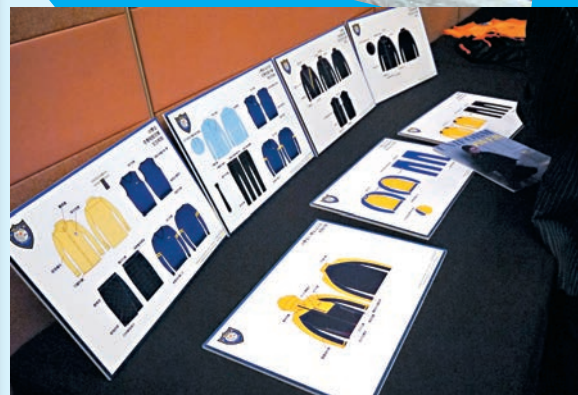
制服動力為澳門利瑪竇中學設計的校服樣板