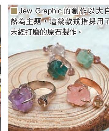
Jew Graphic 的創作以大自然為主題，這幾款戒指採用了未經打磨的原石製作。