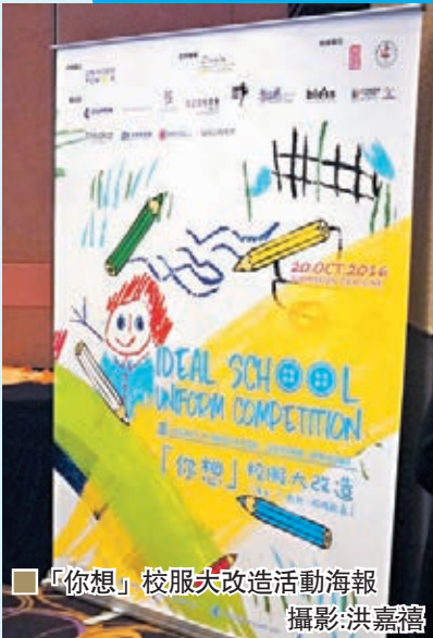
「你想」校服大改造活動海報

她更希望可以把生活觸覺、時裝潮流、香港獨有文化藝術融入於校園生活當中，一方面推動學生發揮創意，鼓勵香港學生發揮創意和想像力，與同學們一起實現校服革新的夢想；另一方面透過比賽，發掘更多有概念和才華的新一代設計師，促進本土時裝業的發展。