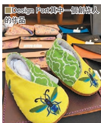
Design Port 其中一個創作人的作品

欣賞文創市集的同時，這兩天亦有很多不同打扮的Cosers為場地增添氣氛，他們都是參加深圳動漫節CPA榮譽盛典Cosplay比賽，超過五百名Cosers進行PK，而專程由香港到來、擁有超過十多年演出經驗的動漫女神ACG Goddess更現身會場作嘉賓示範，成為場內攝影發燒友爭相集郵的焦點。