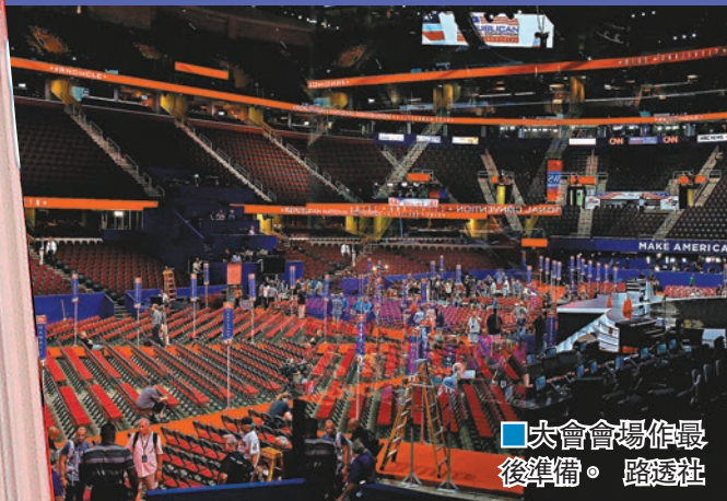
■大會會場作最後準備。