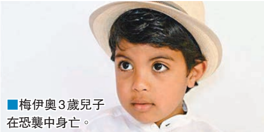
■梅伊奧3歲兒子在恐襲中身亡。

尼斯恐襲死者包括10名兒童，仍有多名年幼傷者徘徊生死邊緣。其中一對父母驚險避過死神，卻親眼目睹4歲兒子被貨車撞飛9米致死，父親形容「心臟像被扯離身體」。