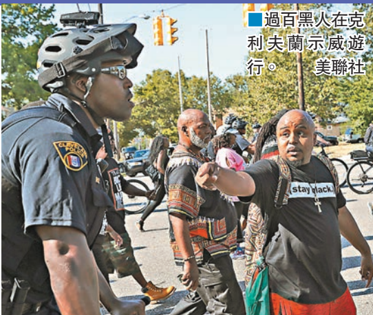
■過百黑火在克利夫蘭示威遊行。

美國共和黨今日於俄亥俄州克利夫蘭舉行全國黨代表大會，預料有大批民眾到場示威。當局為加強保安，規定在會場外的示威區內，一律禁止民眾攜帶網球、玩具槍、水槍、雨傘或噴漆鐵罐等物品，但因為當地《公開攜帶槍法》所限，示威者可自由攜帶真槍實彈到場。有評論形容事件反映美國槍械政策荒謬至極，更擔心示威區會淪為子彈橫飛的戰場。