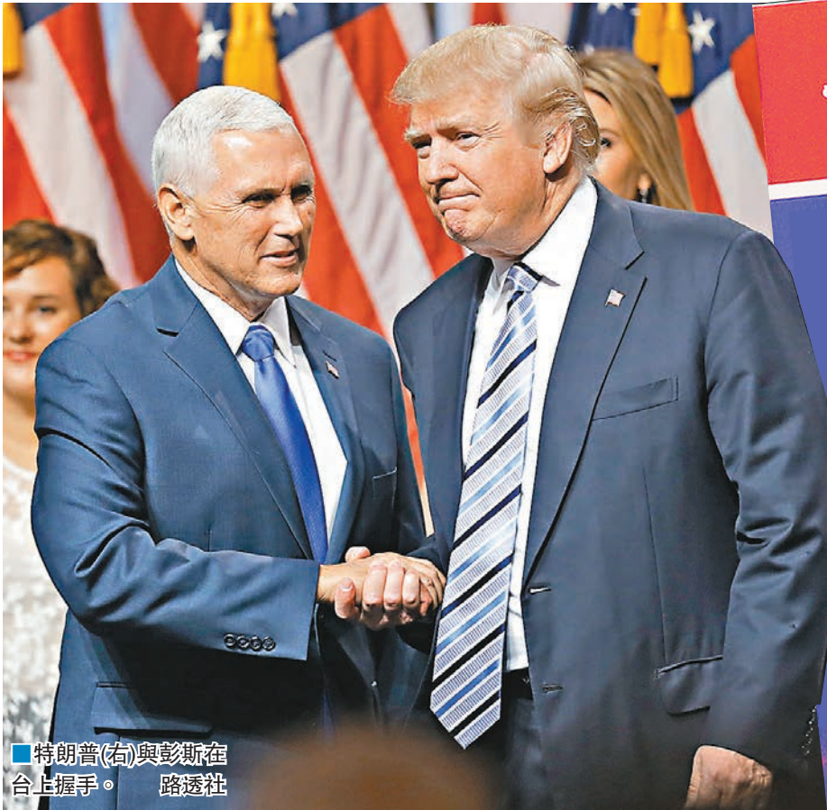
■特朗普(右)與彭斯在台上握手。

一連四天的美國共和黨全國代表大會，今日於俄亥俄州克利夫蘭市開幕，預料特朗普將正式成為總統候選人，代表共和黨出戰年底大選，與民主黨的希拉里競逐入主白宮。由於特朗普經常發表惹火言論，加上美國近期種族緊張關係升溫，黑人權益團體「新黑豹黨」和白人至上組織都揚言舉行示威，俄州寬鬆的槍械法更令大會保安蒙上陰影。部分與會代表更密謀「拉布」，阻止特朗普成共和黨總統候選人。