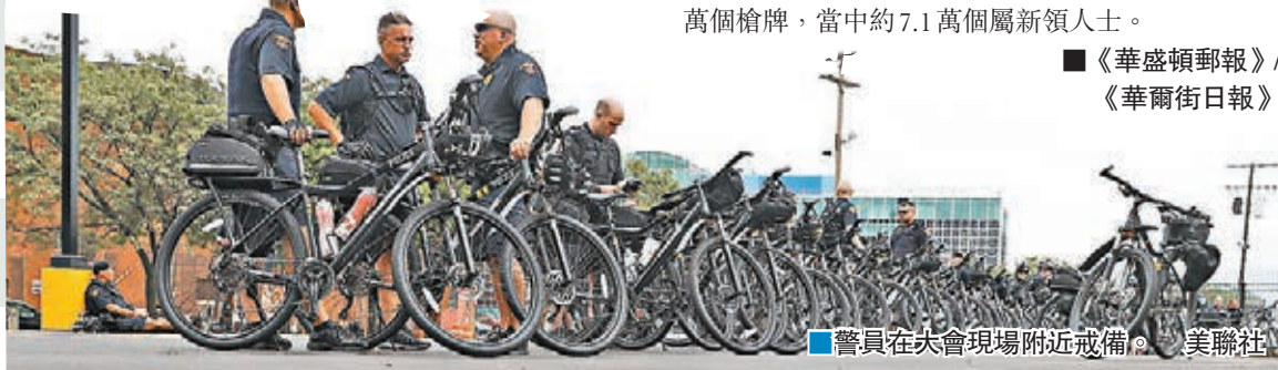
■警員在會現場附近戒備。