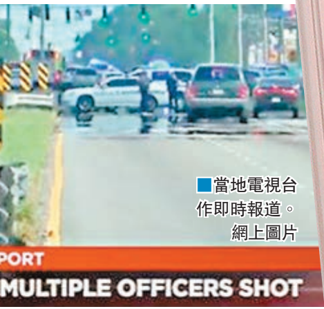
■當地電視台作即時報道。網上圖片

巴吞魯日市37歲黑人男子斯特林早前在便利店門口售賣光碟期間，懷疑與警員發生爭執，遭連開多槍射殺，引起爭議及觸發連串示威，其中在得州達拉斯舉行的一場相關示威，有槍手射殺5名警員，宣稱是要報復警方對黑人濫用武力。 ■《星期日鏡報》