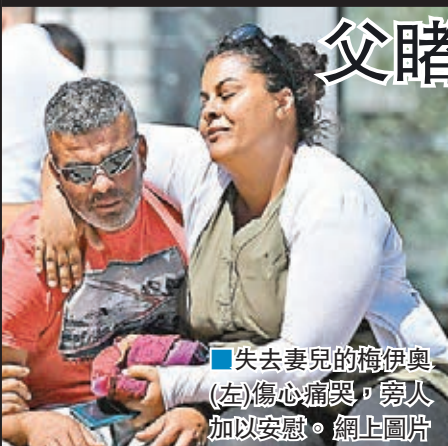
■失去妻兒的梅伊奧(左)傷心痛哭，旁人加以安慰。