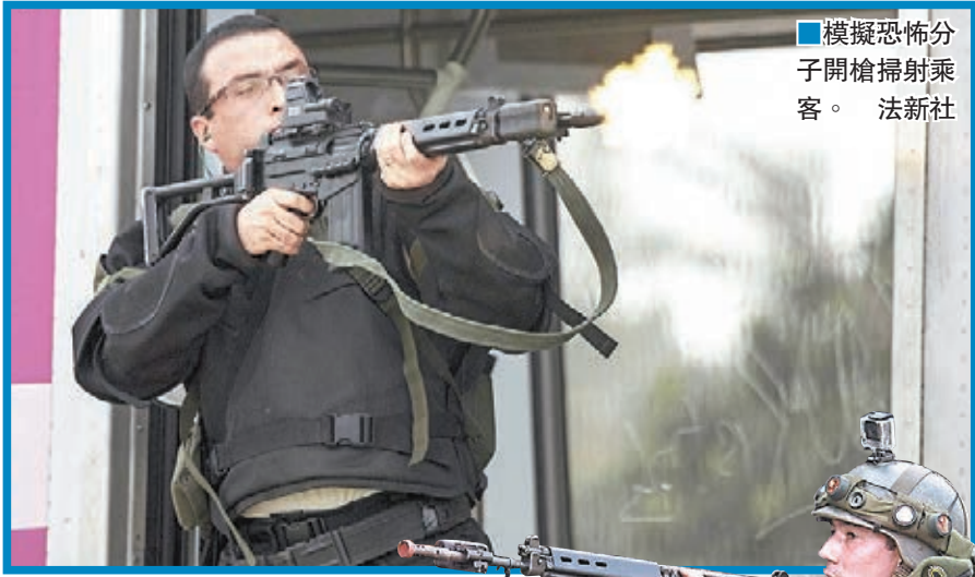
■模擬恐怖分子開槍掃射乘客。