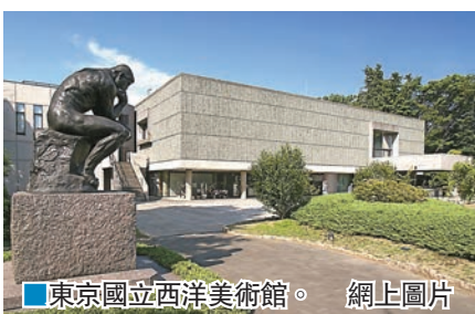
■東京國立西洋美術館。網上圖片

聯合國教科文組織(UNESCO)世界遺產委員會昨日決定，將20世紀最偉大建築師之一、「功能主義之父」柯比意的一系列作品，列入世界文化遺產，包括東京上野國立西洋美術館、法國薩瓦別墅等17幢建築。