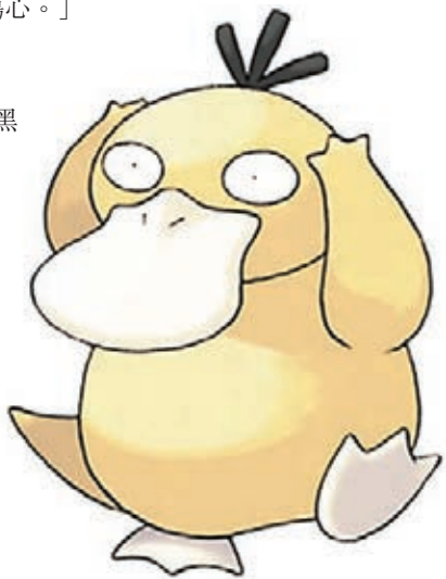
■美國有線新聞網絡/《星期日郵報》/Mashable網站

一個相對較新、由6名成員組成的黑客組織「PoodleCorp」在香港時間前晚9時左右於twitter發文，聲稱成功以「分散式阻斷服務」(DDoS)攻擊《Pokemon GO》伺服器，還警告將發動更大規模攻擊。《Pokemon GO》營運商Niantic前日發佈的公告則未有提及遭到黑客入侵，僅稱伺服器出現問題，正在努力修復。