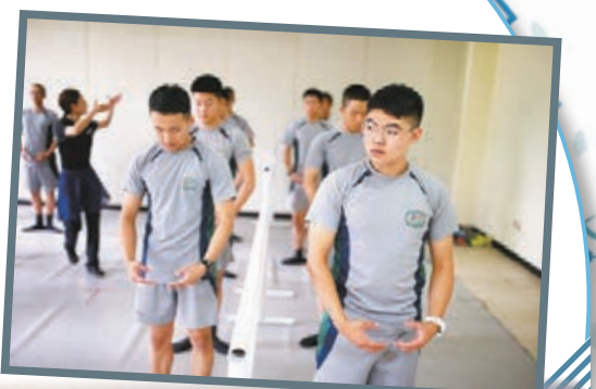
■士兵在導師指導下學習踢腿。

不少士兵均是初學，雖然體格強健，但筋骨稍欠柔軟，難以做出提腿或「一字馬」等動作。不過士兵坦言，學舞可保心境平靜，有助減壓，更可增進與同袍友誼，計劃退役後繼續跳舞。