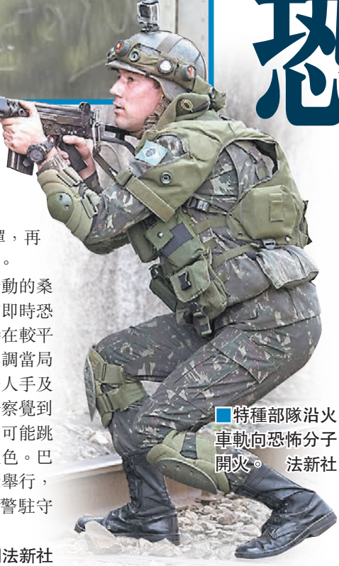
■特種部隊沿火車軌向恐怖分子開火。

巴西里約熱內盧奧運揭幕在即，當局繼續加強保安措施，前日在鄰近里約奧運比賽場地的德奧多魯火車站舉行反恐演習。軍方反恐部門指揮官辛諾特表示，今次屬區內演習，與當地以舉球賽前所進行的演習相同，有助保安人員適應實戰環境。 演習模擬兩名恐怖分子在火車內引爆炸彈，然後開槍掃射乘客。10多名士兵先到場戒備，特種部隊再用直升機趕赴現場，聽取匯報後作出部署。