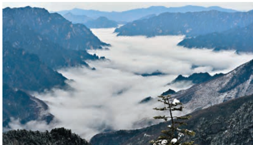
湖北神農架申遺成功。圖為神農架神農農頂景區雲海。

正在土耳其伊斯坦布爾舉行的第40屆聯合國教科文組織世界遺產委員會會議(世界遺產大會)17日把湖北神農架列入世界遺產名錄,中國的世