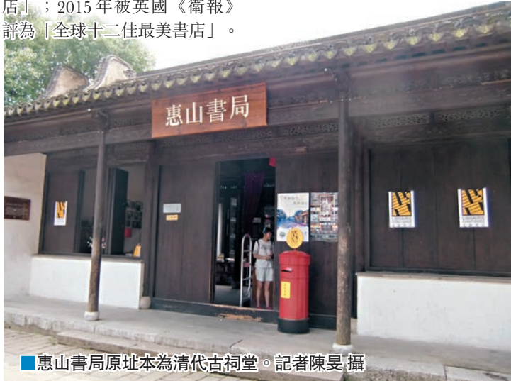
惠山書局原址本為清代古祠堂。

最美書店」;2014年被英國BBC評為「全球十佳最美書店」;2015年被英國《衛報》評為「全球十二佳最美書店」。