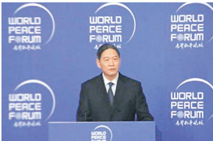
張志軍在世界和平論壇上強調一個中國原則是兩岸關係的定海神針。

張志軍指出，今年以來，黨和國家領導人多次強調我們的對台大政方針是明確的、一貫的，宣示了反對「台獨」、維護國家主權和領土完整的堅定意志，表明了願意繼續在「九二共識」基礎上推動兩岸關係和平發展的誠懇願望。無論台灣哪個政黨、團體，無論其過去主張過什麼，只要承認「九二共識」的歷史事實，認同其核心意涵，我們都願意同其交往，共同推進兩岸關係和平發展。兩岸關係走向攸關兩岸民眾的切身利益，攸關中華民族的未來，沒有人比我們更希望維護兩岸關係和平發展與台海和平穩定。希望國際社會和有關國家繼續恪守一個中國政策，理解和支持中國政府和中國人民維護台海和平穩定、推動兩岸關係和平發展、實現祖國統一的正義事業。