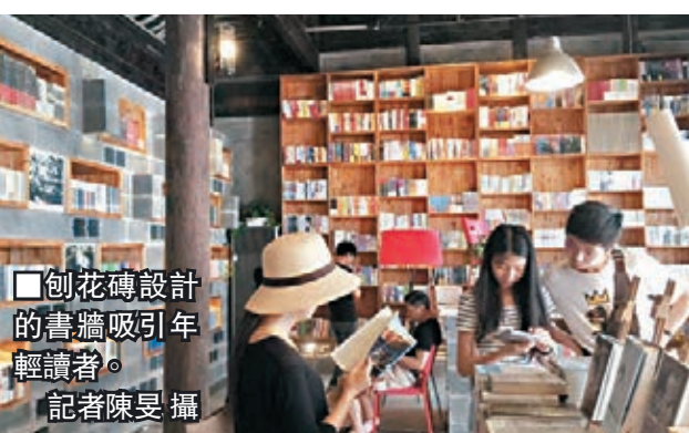
創花磚設計的書牆吸引年輕讀者。

江蘇無錫惠山古鎮是中國現存祠堂最為密集的区域,古鎮集中了當地80個姓氏的逾110個祠堂,前後跨度達2,000餘年。而2016年被《美國國家地理雜誌》評為「全球十佳書店」的江蘇南京先鋒書店,則把新分店落成於此地。書店創辦人稱,選址惠山古鎮,皆因他希望惠山書局能為當地提供富有詩意、開放獨立的公共文化空間,讓更多的民眾在此體會傳統文化的核心精髓,汲取現代人文精神力量。