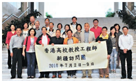
香港高校教授工程師新疆訪問團一行在新疆師範大學合影留念。

香港文匯報訊(記者應江洪 新疆報道)由香港著名工程師、銅紫前星章獲得者、特區政府土力工程處處長陳健碩率領的香港高校教授工程師訪問團一行20餘人近日蒞臨新疆,並深入烏魯木齊、吐魯番、石河子、阜康等地欣賞邊疆美景、體驗民俗風情、與新疆師範大學等部分高校座談交流,共謀「一帶一路」下的合作發展……七天的緊張行程,這些工程界的「大咖」們說得最多的話就是「大美新疆」美得超乎想像、發展超乎想像。