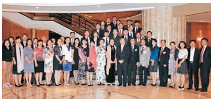
培華基金會宴會廳中高級公務員經濟管理研討班學員合影。