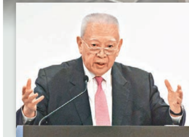
全國政協副主席董建華指出，仲裁庭日前在海牙作出的所謂「裁決」，很可能導致危機，引發嚴重後果。

是次「海洋爭端解決國際法研討會」剛好在南海爭議「被裁決」後舉行，被邀作主旨演講的全國政協副主席董建華就表示，中國向來抱「以和為貴」的態度去解決領土爭議，仲裁庭日前在海牙作出的所謂「裁決」，很可能導致危機，引發嚴重後果。他呼籲菲律賓透過協商，與中國合作、建立互信及共同發展經濟利益，轉危為機；並呼籲美國反思導致相關國家在南海分裂的真正分歧是什麼，以免影響中美關係。