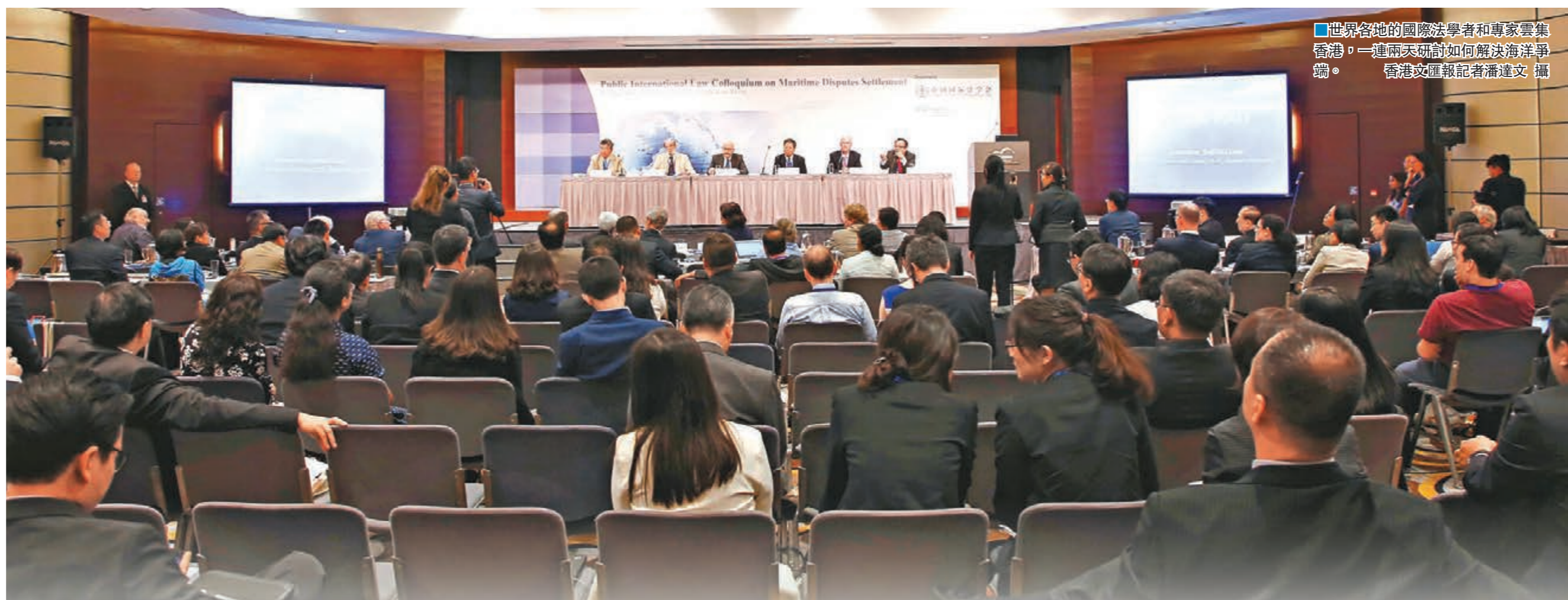
世界各地的國際法學者和專家雲集香港，一連兩天研討如何解決海洋爭議。

她強調，法庭應善意、全面、完整地準確解釋或適用《公約》，並依法讓各國享有自主選擇爭端解決方式的權利。