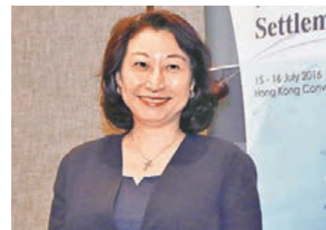
香港國際仲裁中心主席鄭若驊。

「海洋爭端解決國際法研討會」圍繞四大主題進行討論，包括領土主權、海洋權利和國際法的應用；有關群島和島嶼的法律與做法；《聯合國海洋法公約》強制程序的適用性；前提、限制和例外；國際法中的歷史性權利。活動還選得全國政協副主席董建華作主旨演講（見另稿），及設有討論近日南海仲裁案等個別議題。