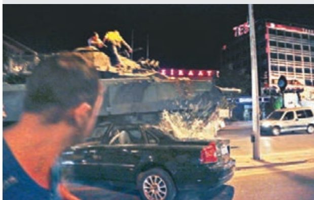
■ 坦克輾爆車輛的擋風玻璃。