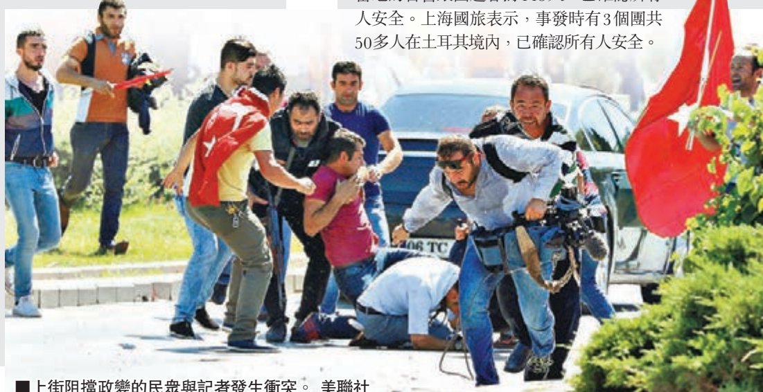
路透社 ■ 上街阻擋政變的民眾與記者發生衝突。美聯社