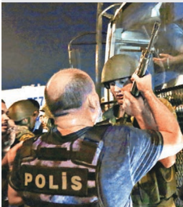
■ 警員要求士兵繳械。