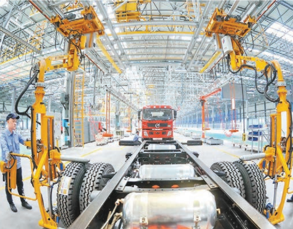
■內地上半年製造業投資、房地產投資放緩。圖為工人在中航工業（邢台）卡車總裝車間生產線上工作。

香港文匯報訊（記者 海巖 北京報道）內地二季度經濟成績單昨日全部出爐。國家統計局數據顯示，二季度國內生產總值（GDP）同比增長6.7%，與一季度增速持平，但仍處2009年一季度以來新低。上半年投資低迷，增速降至十六年來最低水平，民間投資增速更罕見降至2.9%。專家表示，當前內地經濟的最大風險在於房地產和民間投資繼續下滑，預計下半年GDP增速穩中有降。