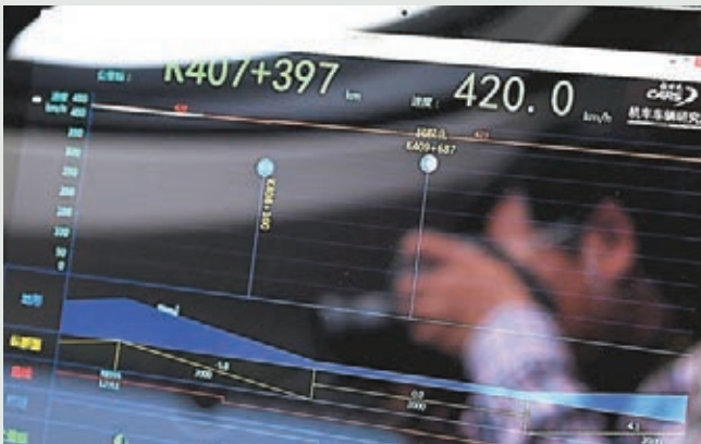
■試驗中標準動車組的儀錶盤上顯示的列車時速達到420公里。

香港文匯報訊（記者 馬琳 北京報道）昨日上午，中國標準動車組開始了一趟全新「試跑」，成功實現了時速420公里兩車交會及重聯運行目標。這是世界上首次利用擬運營動車組進行時速400公里以上的運行試驗，而由中國自行設計研製、全面擁有自主知識產權的中國標準動車組再次刷新了世界紀錄。