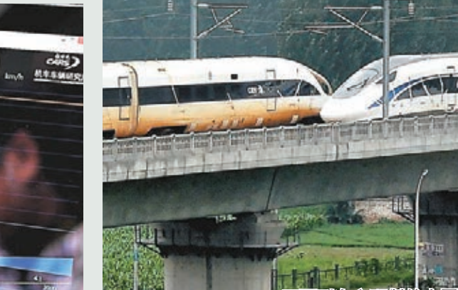
■兩列自主研製的中國標準動車組昨日上午在鄭（州）徐（州）線上，分別以420公里的速度交會而行。

中國標準動車組綜合試驗組負責人、中國鐵路總公司科技管理部主任周黎介紹，420公里的運行時速是目前世界上動車組的最快紀錄。