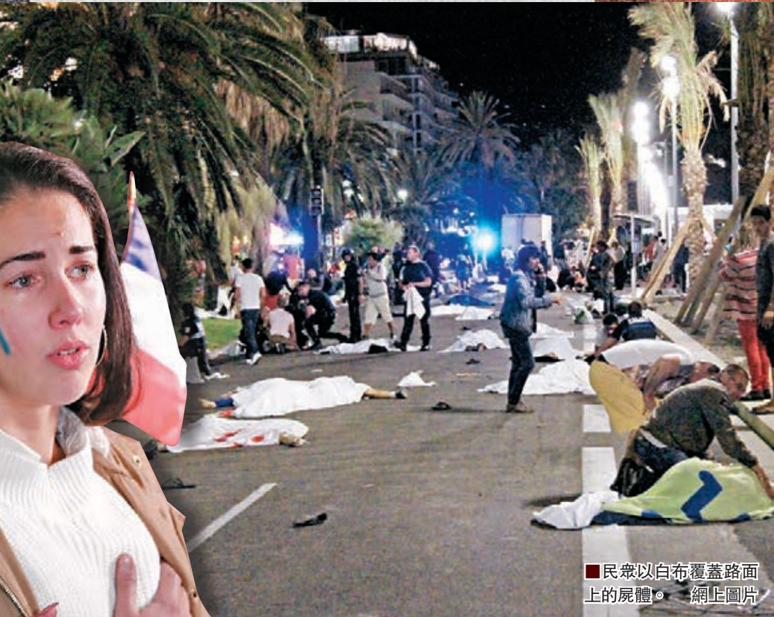
■民眾以白布覆蓋路面上的屍體。