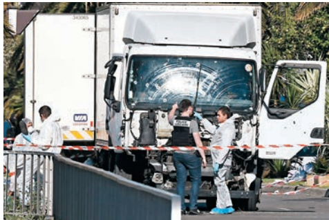
■法證人員和警察在兇徒駕駛的貨車附近搜證。