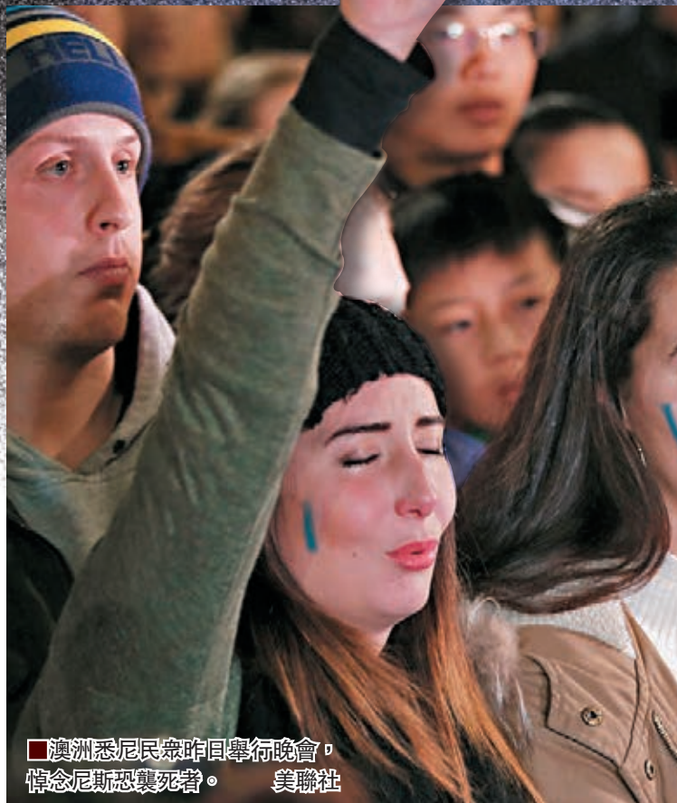
■澳洲悉尼民眾昨日舉行晚會，悼念尼斯恐襲死者。

法國前日國慶「巴士底日」慘變國殤日！東南部旅遊城市尼斯在當晚國慶煙花匯演結束後，一架重型貨車突高速衝向聚集海旁的人群，在行人道橫衝直撞兩公里，司機更連開多槍，造成最少84死，約50多人危殆，10名死者是兒童，另有兩名傷者是中國公民，總統奧朗德定性事件為恐襲，暫未有組織承認責任。法媒引述未經證實消息指，襲擊是由極端組織「伊斯蘭國」(ISIS)策動，目擊者則指貨車司機開槍前曾高呼「真主至大」。這亦是法國一年半以來第三次嚴重恐襲。