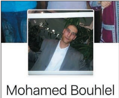
■疑兇的社交網站頁面。

布赫勒所使用的貨車，是在恐襲前兩天於附近一個城鎮租用，然後駛至尼斯。法國法例規定重型貨車不得於假日在路上行駛，但送貨則一般獲豁免，令布赫勒得以用送雪糕為藉口，留在海邊大道，等至晚上才發動襲擊。也有報道指，他當時是駕駛貨車撞倒圍欄，再駛入海濱大道行兇。