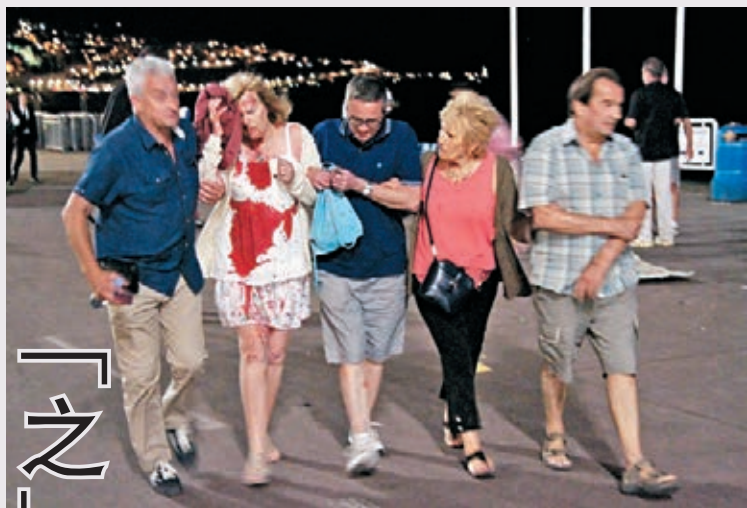
■一名受傷女遊客與同伴離開現場，驚魂未定。網上圖片