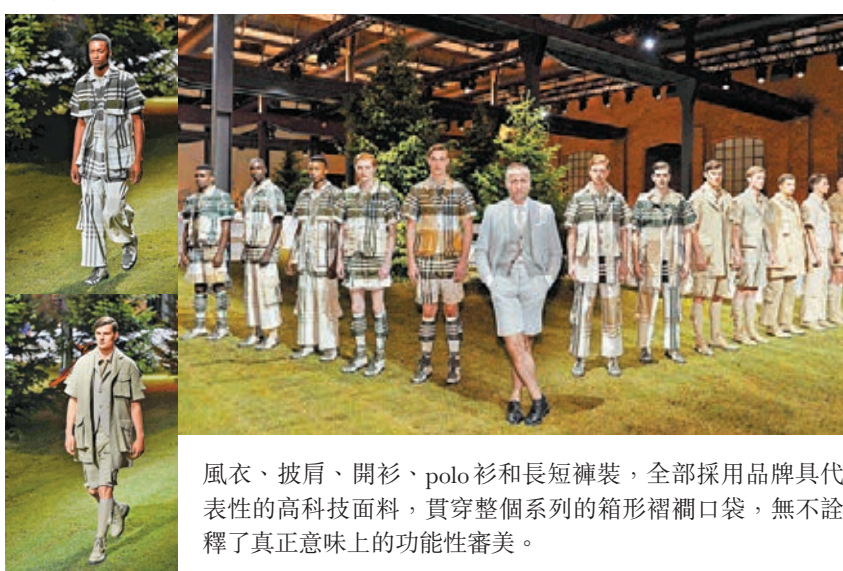
風衣、披肩、開衫、polo 衫和長短褲裝，全部採用品牌具代表性的高科技面料，貫穿整個系列的箱形褶襬口袋，無不詮釋了真正意味上的功能性審美。

這個春夏系列將美國童子軍與夏令營的概念融於主題，靈感源自童子軍制服的全新系列通過三種色彩組合得以完美呈現：沉靜大氣的卡其色，鮮明跳脫卡其/純淨白/森林綠/棕色格紋，以及由棕色與森林綠組成的正裝禮服部分。系列囊括了眾多 Thom Browne 經典手工剪裁服飾精品，譬如運動外套、切斯特菲爾德式大衣、