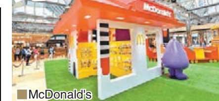
借出珍貴藏品。經典之最為當年人氣爆燈的史諾比世界之旅系列、Hello Kitty 戀愛麥語、101 斑點狗系列，以及充滿懷舊色彩的麥當勞變形鐵甲人等，等您一次過盡情鑑賞，齊齊「召喚」當年美好回憶。