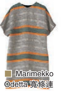
Marimekko Odetta 寬條連身裙。