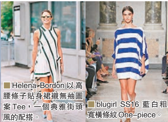
Helena-Bordon 以高腰條子貼身裙襯無袖圖案Tee，一個典雅街頭風的配搭。