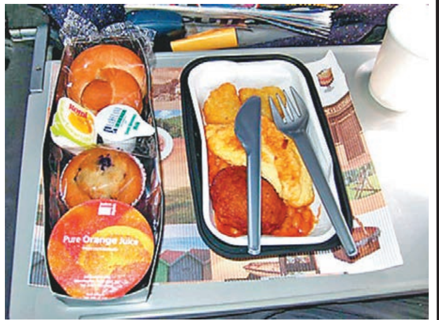
飛機餐有很多種類，英國航空公司就曾因為停派牛肉餐而引起爭議。

還有不同的飛機餐種類，可是我怕再說下去，大家都睡着了，還是就這樣吧。這個學期又完了，大家不妨去旅行散散心，不過千萬要記住，提早回港日期，別因飛機 delay (延誤)，9月1日開學時還在飛機上就尷尬了！