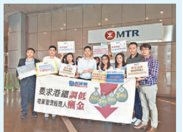
立法會議員到港鐵總部請願，要求把經理人酬金降至 5%。資料圖片

港鐵應該立即將物業管理的經理人酬金由 8% 下調至 5%，與一般物業管理公司看齊，以及研究將物業管理酬金與開支脫鈎，參考其他物業管理公司的做法，以定額方式收取酬金，以免出現開支越大，酬金越高的不公現象。