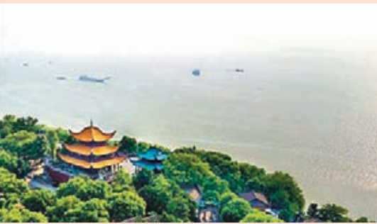
《岳陽樓記》中「浩浩湯湯」的「湯」，到底要怎樣讀呢？資料圖片

譬如最近朋友來問的「問題」便有：說人運氣差的，該是「倒楣」、「倒霉」還是「倒煤」，哪個才是正確呢？很受歡迎的台灣「教育部」的國語辭典，三個都有收到，並且都各有依據啊！來問的朋友，更附上台灣記者訪問一舉學者論此三個字形解說的短片。