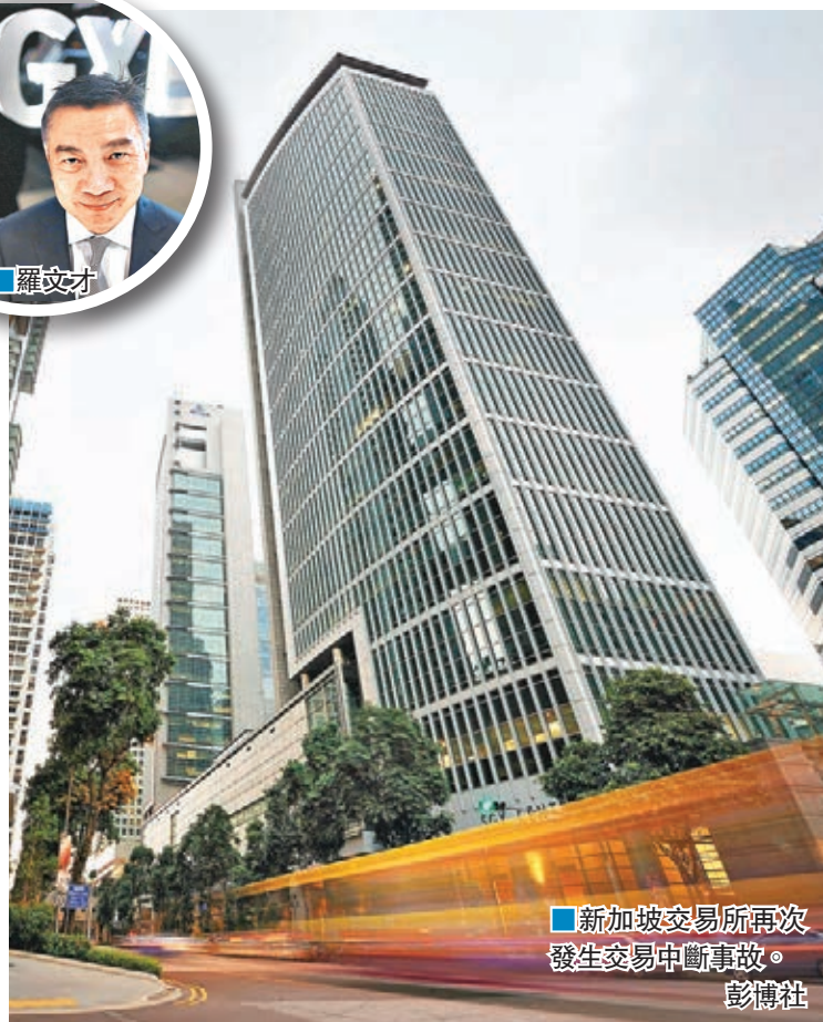
新加坡交易所再次發生交易中斷事故。