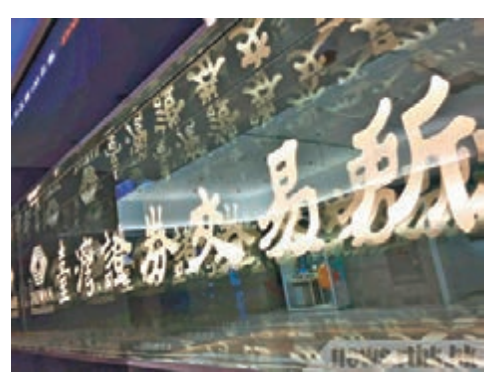
台灣股市今年以來獲81億美元外資流入，為區內股市吸金王。

他指出，亞股題材多元，在今年市場持續估值有回升行情，亞股評價未來有機會回升，資金面的寬鬆令熱錢四竄，具有投資收益商品首先獲得青睞，資金仍將尋找出路，新興亞洲將有機會持續受惠。