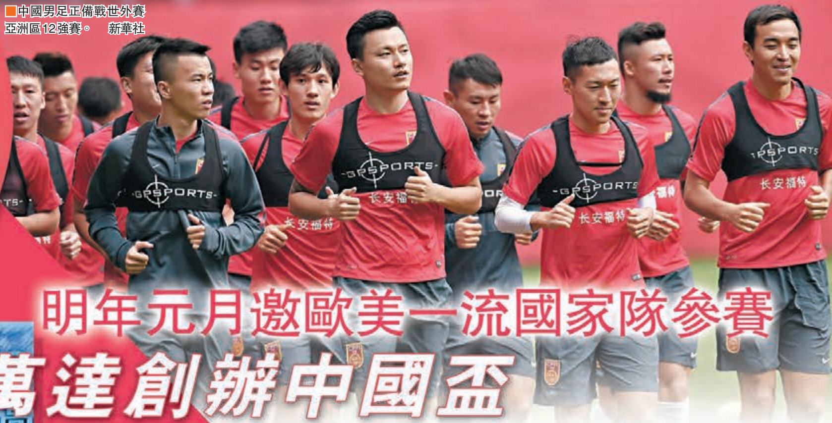
中國男足正備戰世外賽亞洲區12強賽。

香港文匯報訊(記者張聰北京報道)萬達集團昨日在京召開新聞發佈會宣佈,首屆「中國盃」國際足球錦標賽(簡稱「中國盃」)將於明年1月9日至16日在廣西南寧市舉辦,屆時來自歐洲、美洲的三支一流國家隊將與中國國家隊舉行4場比賽。萬達集團董事長王健林表示,自己一生摯愛足球,衷心期盼中國國家隊能征戰世界盃,創辦「中國盃」就是支持中國足球振興,未來萬達集團將努力使「中國盃」的比賽水平超越亞洲盃,成為亞洲第一國家隊賽事。