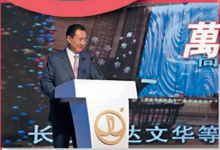
萬達集團董事長王健林致辭。

萬達集團表示,中國作為世界足球人口最多的國家,近幾年足球職業聯賽進行得如火如荼,職業俱樂部水平已經躍居亞洲一流。但中國國家隊由於缺少正式比賽機會、國際比賽經驗不足等多種原因,成績落後於中國足球聯賽。萬達集團指出,為增加中國國家隊鍛煉機會,提升中國國家隊競賽水平,振興中國足球,萬達花費兩