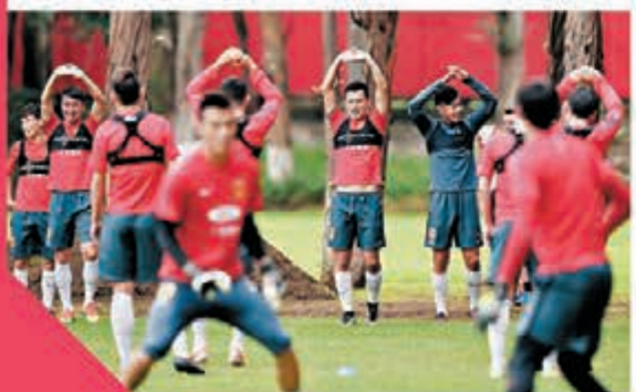
中國男足月初在昆明海埂集訓。

萬達集團相關負責人表示,由於首屆「中國盃」適逢中國國家隊正在衝擊2018年俄羅斯世界盃,為有助於中國隊征戰,首屆「中國盃」特意邀請3支與亞洲競爭對手風格相近、水平更高的國家隊參加,而從2018年開始,「中國盃」將邀請歐洲、美洲頂級國家隊參賽,一批中國球迷熟悉的國際巨星將有望出現在「中國盃」賽場上。