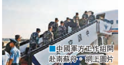
■中國軍方工作組開赴南蘇丹。

香港文匯報訊 據新華社報道，中國軍隊派出工作組於昨日下午6時許乘空軍飛機趕赴南蘇丹朱巴地區。工作組將看望慰問中國維和部隊官兵，現場指導部隊加強安全防衛，協調處理傷亡人員善後工作，接回殉職軍人遺體和傷員。