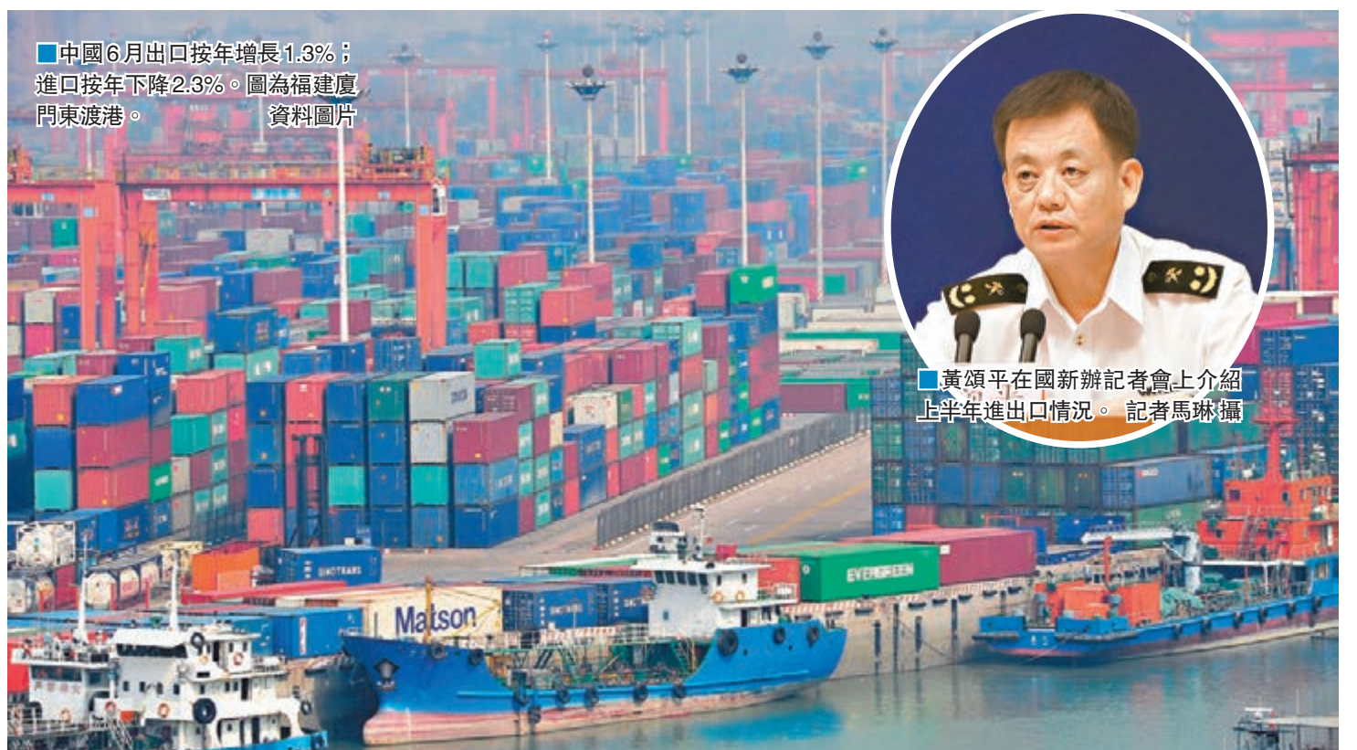
■中國6月出口按年增長1.3%；進口按年下降2.3%。圖為福建廈門東渡港。資料圖片