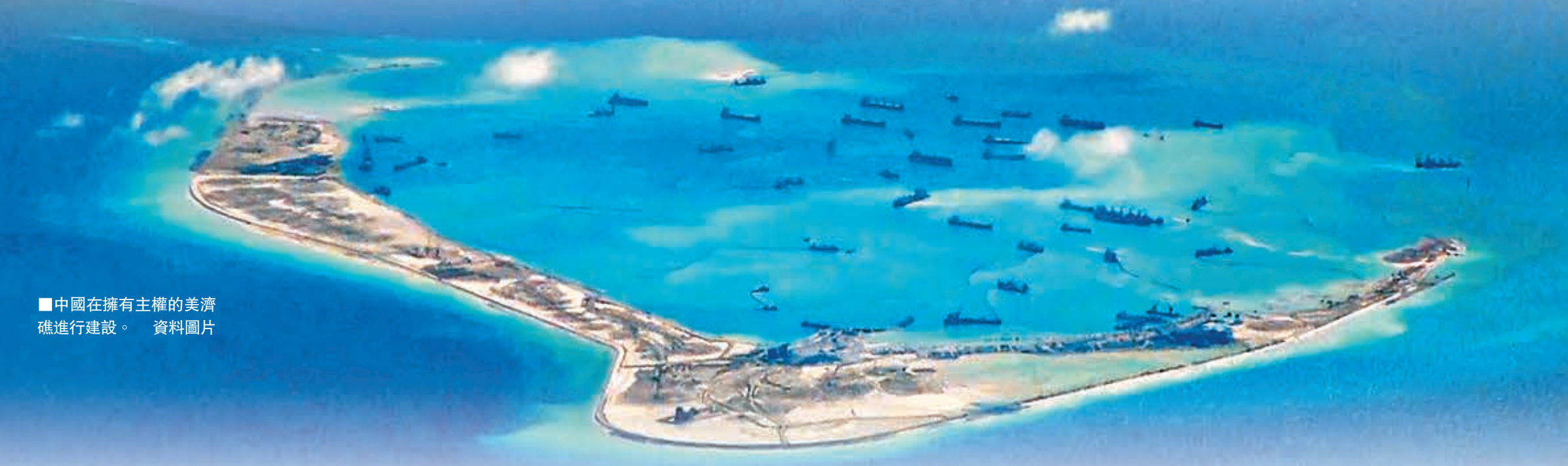
中國在擁有主權的美濟礁進行建設。資料圖片