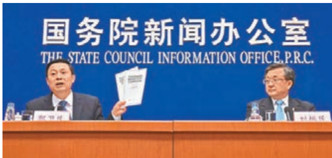
外交部副部長劉振民(右)和國務院新聞辦公室副主任、新聞發言人郭衛民介紹白皮書和中國在南海問題上的政策立場。

香港文匯報訊(記者 葛沖 北京報道)「如果我們的安全受到威脅，當然有權劃設防空識別區，這取決於我們的綜合判斷。」對於所謂南海仲裁案後中國是否會在南海設立防空識別區問題，外交部副部長劉振民昨日在北京作出上述表述。他提醒菲方攪局不會有好結果，希望其他國家不要藉機來威脅中國，不要把南海變成一個戰爭的發源地。同日，中國國務院新聞辦公室發表白皮書，堅持通過談判解決爭議。