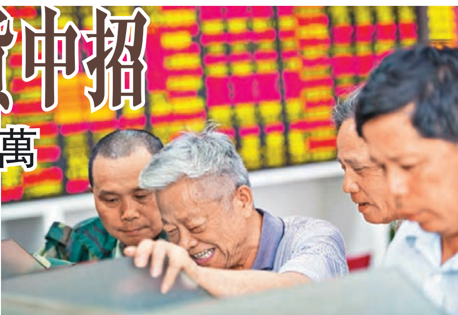
得益於權重股發力,滬綜指昨收報3,049點,升1.82%。

此外,煤炭、鋼鐵、券商、食品飲料等股亦漲幅居前。近來黃金股狀態大起大落,昨日領跌,貴金屬股下挫逾2%,中韓自貿、青海股類亦呈弱勢,收於綠盤。