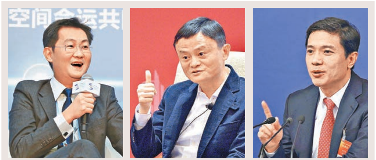
騰訊、阿里巴巴、百度等內地科網巨頭紛加入智能汽車的研發大潮。圖為馬化騰(左)、馬雲(中)及李彥宏。

不過,智能汽車的發展目前仍未成熟,美國知名電動商、最早推出自動駕駛的Tesla,近日就發生多起致命意外,包括發生在佛羅里達州、釀成司機死亡的意外,Tesla的自動駕駛系統被指與多起意外有關。事後Tesla多次強調自動駕駛系統仍處於公測模式,司機啟動系統後並不代表不用留意道路情況。此外,Tesla呼籲司機在沒有中央分界線的道路上行駛時,不要啟動自動駕駛系統,顯示自動駕駛技術有待改進。