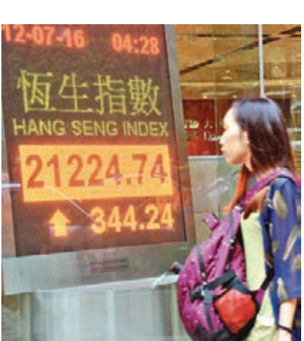
港股連升兩日,昨高開後繼續抽升,收漲344點,成交增至716億元。

煤炭股獲追捧,成為市場焦點,發盈喜的中煤(1898)急升7.3%,神華(1088)大漲5.2%,是藍籌表現最佳。多隻房託基金亦創新高,領展(0823)收升3.4%,香港電訊(6823)及港燈(2638)再創新高,各收11.82元及7.49元。濠賭股亦有大幅造好,永利(1128)升逾半成,銀娛(0027)及金沙(1928)各升逾4.2%及3%。