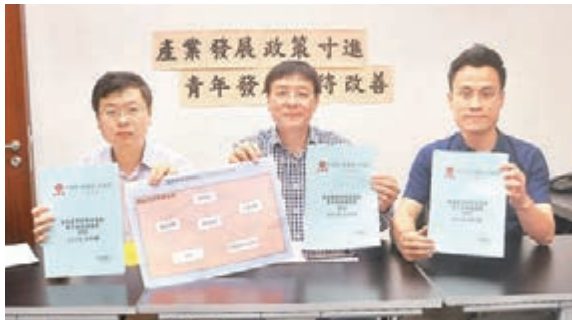
工聯會公佈《香港產業創新政策與青年發展建議書》。