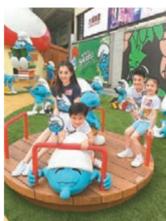
海運大廈露天廣場變身成巨型藍精靈村莊。

香港文匯報訊(記者 馮健文)訪港旅客人數近期仍呈跌勢，整體零售市道也依然疲弱，但海港城訪客人流不減反增，市道跌勢亦收窄。管理海港城的九龍倉昨日指，由於商場以本地客為主，加上近期來自韓國、泰國、印尼及菲律賓等地的訪客有所上升，加上來自內地二三線城市的新客源，令人流量較去年同期微升。為增加吸引力，商場今日起引入藍精靈亞洲巡迴藝術展，令訪客有新體驗。