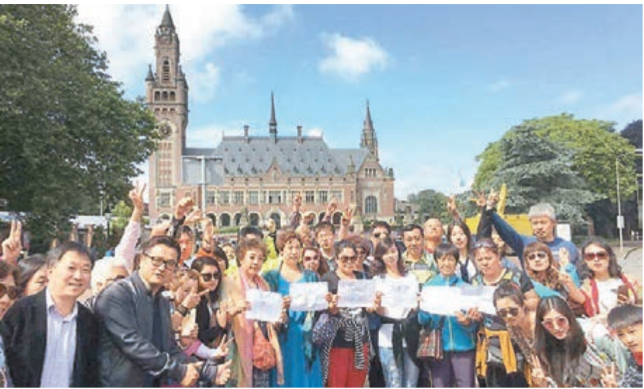
■愛國僑胞同遊客一起抗議非法仲裁。

香港文匯報訊 據新華社報道，昨日的所謂最終裁決結果一出，便立即受到海外華僑華人強烈抗議，強調抗爭絕不會缺席。 澳洲大華聯會在第一時間發表聲明。他們認爲，仲裁庭一直以菲律賓的違法行爲和非法訴求爲基礎，進行所謂的庭審和裁決，不具有合法性，是無效的、沒有約束力的。 混淆是非 有違道德 歐洲華僑華人社團聯合會就所謂裁決結果發出緊急通知，並表示這是海外遊子為祖（籍）國守疆衛土的關鍵時刻。全歐近300萬同胞應迅速行動起來，通過各種途徑展示歐洲華僑華人不畏強權、追求正義、和平愛國的情懷和心聲。