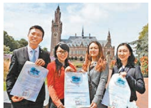
■留學生手持公開信為祖國發聲。 網上圖片

坦桑尼亞主流媒體《每日新聞》發表題爲「中國在南海問題上始終堅持和平立場」的專欄文章，全面介紹南海問題的歷史。坦桑尼亞資深媒體人瑪夸亞·庫亨在專欄文章中表示，中國不會做任何損害自身和他國利益的事情，中國堅持維護南海航行和飛越自由及南海和平穩定。 文章說，眾所周知，西方列強經常公然發動對第三世界國家的軍事侵略，比如伊拉克和敘利亞戰爭，而中國從未在世界任何地方發動過類似的軍事侵略。我們看到的中國，是發展中國家的好夥伴，從不蠻橫自大，也不以大欺小，總是本着謙遜務實的作風與發展中國家合作，這使其在他們中間備受歡迎與愛戴。