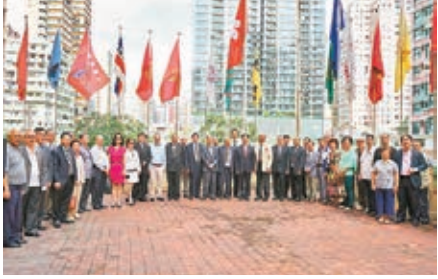
參加升旗儀式嘉賓合照

宏偉磅礴的國歌奏始,鮮豔的五星國旗隨樂聲徐徐上升,隨風飄揚,在場所有人士肅然起敬,向國旗注目禮並高唱國歌。晴空下飛揚的紅旗,象徵了祖國國運亨通,亦祝願香港政通人和,繁榮昌盛。