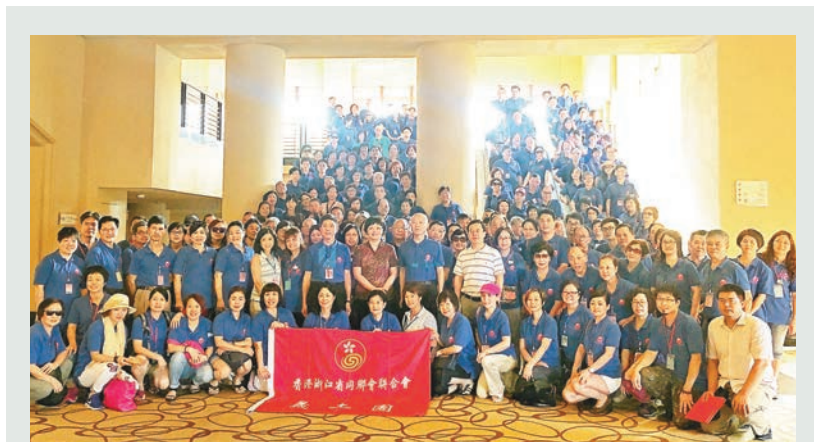
浙聯會義工團珠海交流時合照留念。