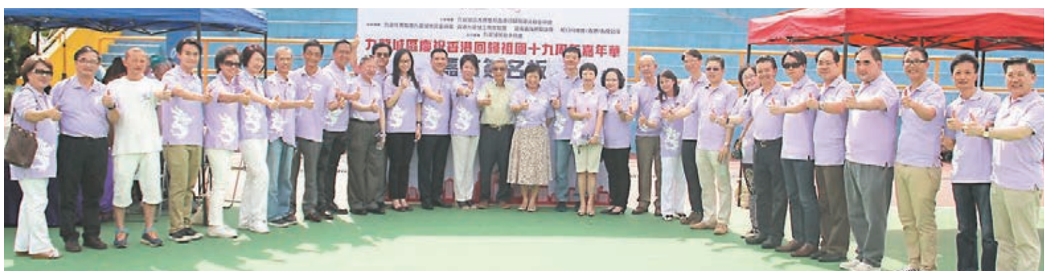
九龍城區慶祝香港回歸祖國19周年嘉年華,賓主歡聚一堂。

當日,嘉年華設攤位遊戲,台上節目精彩紛呈,場面熱烈。大會亦向參加者派發福袋,街坊盡興而歸。