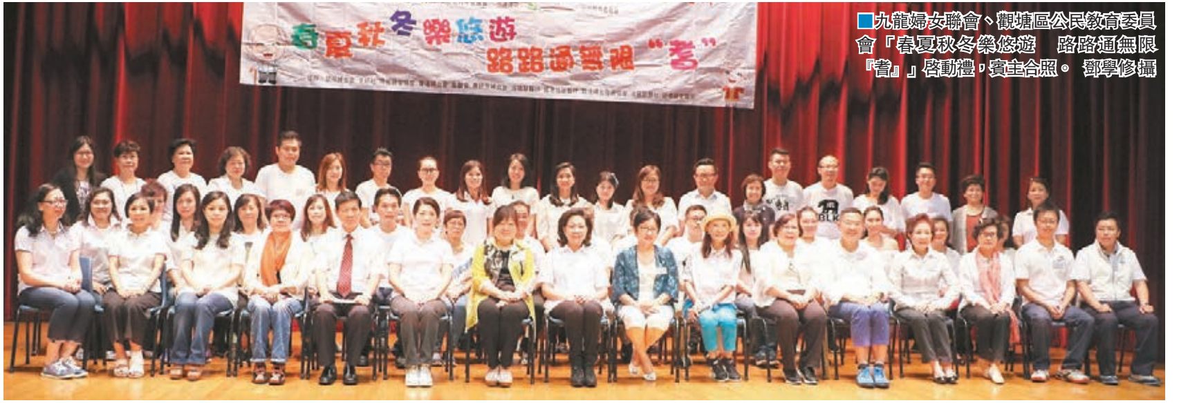
九龍婦女聯會、觀塘區公民教育委員會「春夏秋冬樂悠遊 路路通無限『耆』」啟動禮,賓主合照。

活動分春夏秋冬進行,依照不同季節安排相應節目,例如春天參觀維園花展;聖誕到尖沙咀觀賞燈飾,亦會安排長者參觀歷史博物館、中山公園、濕地公園、妙法寺等地標,長者遊樂時也能增廣見聞。啟動禮日前假觀塘基督教家庭服務中心舉行,特邀行政長官夫人梁唐青儀,中聯辦九龍工作部副部長盧寧,立法會議員謝偉俊,觀塘區議會副主席洪錦鉉,觀塘區